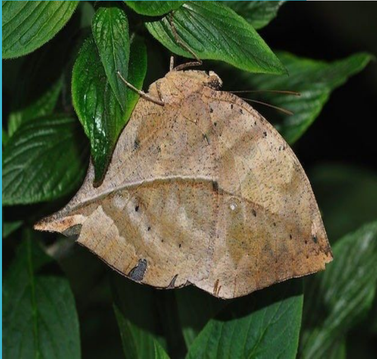
Маскировка у бабочек