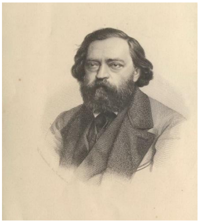
Николай Платонович Огарев (1813 -1877 гг.)

Александр Иванович Герцен (1812 — 1877 гг.) и Николай Платонович Огарев (1813-1877 гг.) оставили богатое литературное наследие.