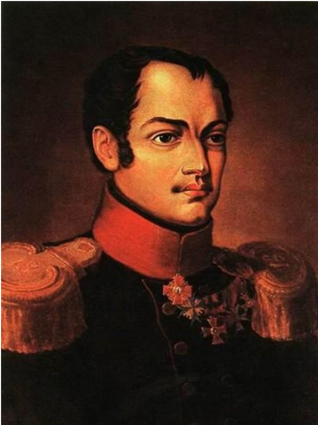
Павел Иванович Пестель (1793 — 1826 гг.)

В работах Павла Ивановича Пестеля (1793 — 1826 гг.)