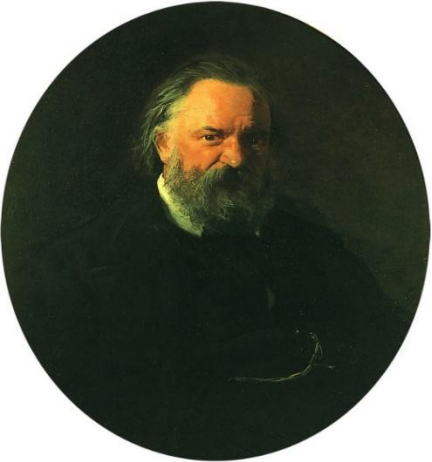
Александр Иванович Герцен (1812 — 1877 гг.)