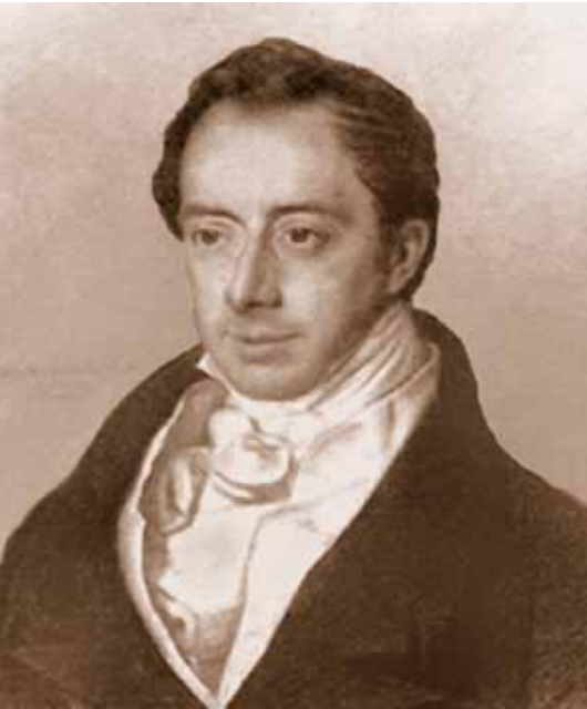
Николай Иванович Тургенев (1789 — 1871 гг.)