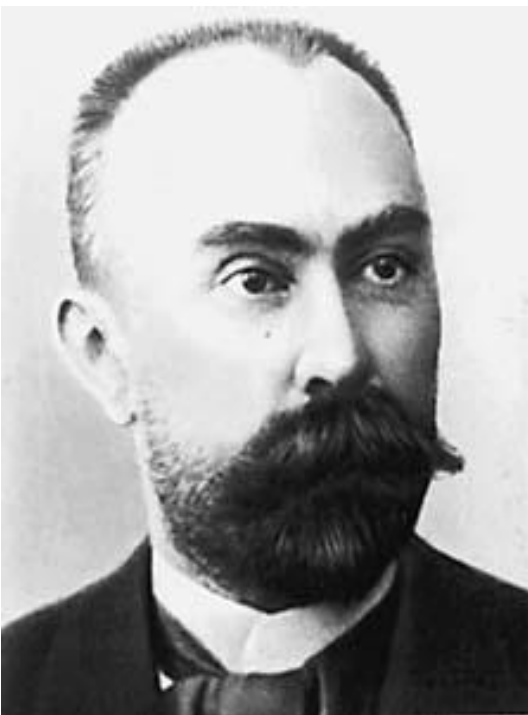
Георгий Валентинович Плеханов (1856-1918 гг.)