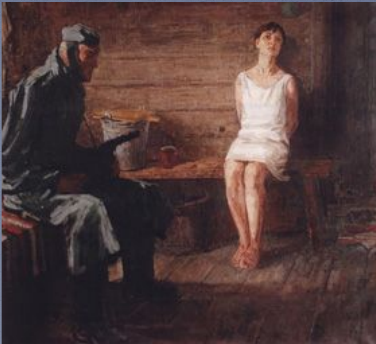
Щукин В.Г. Зоя Космодемьянская - холст, масло