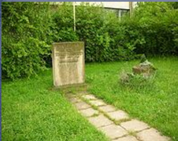
Обелиск в память Зои Космодемьянской перед 46 средней школой в г. Дрезден