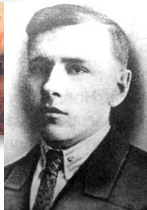
Василий Иванович Чернов