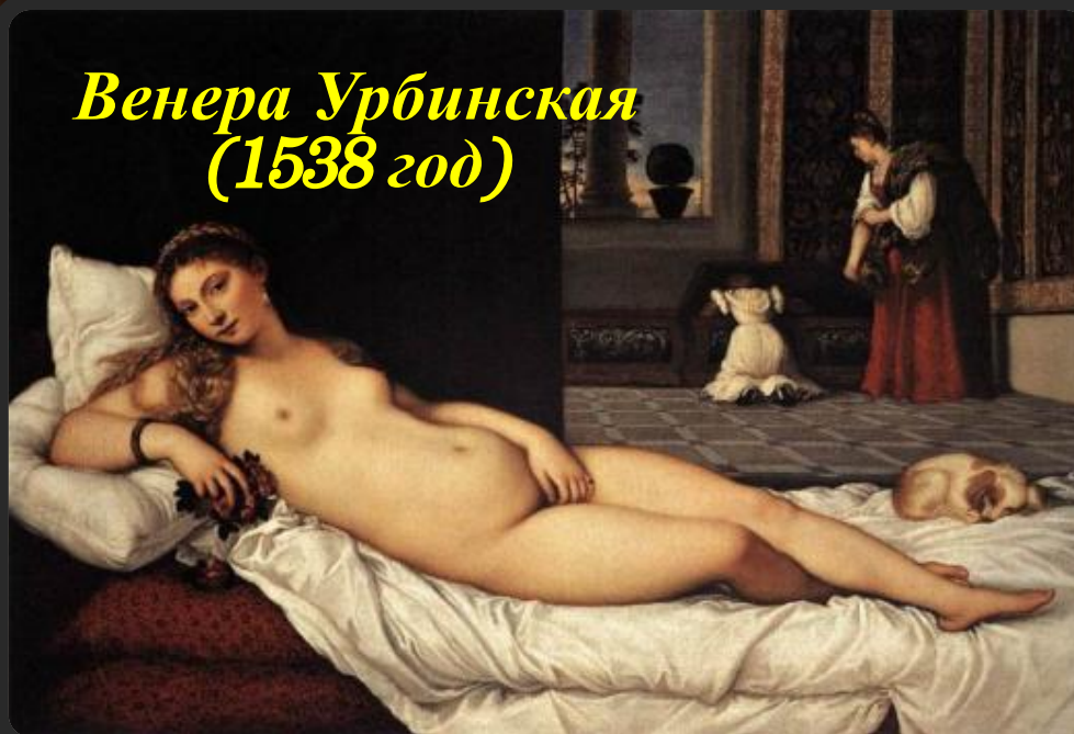
Венера Урбинская (1538 год)

Картину Тициана Венера Урбинская можно сопоставить с Венерой Джорджоне: у Тициана богиня изображена проснувшейся, она полулежит на своем ложе в изысканно убранной комнате. Прекрасная женщина представлена величавой, исполненной чувства собственного достоинства, но ее изображение уже не вызывает ощущения тайны, как в картине Джорджоне.