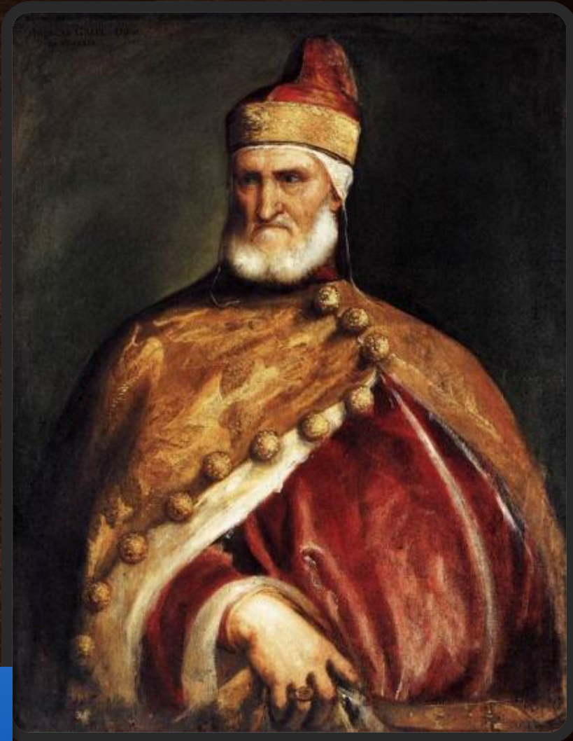
Портрет инквизитора дожа Андреа Гритти

Дожд (итал. doge — «вождь, предводитель») — титул главы государства в итальянских морских республиках — Венецианской, Генуэзской и Амальфийской. Догат — время правления дожа..