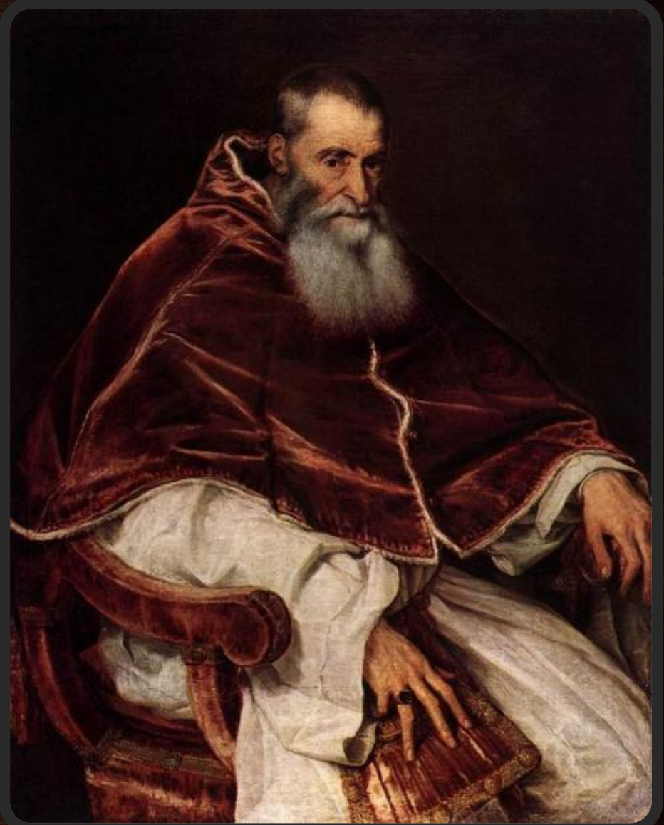
Портрет папы Павла III (1545-1546 гг.)

На неоконченном Портрете папы Павла III с Алессандро и Оттавио Фарнезе (1546, Неаполь, Национальный музей и галерея Каподимонте) представлен немощный, но хитрый старик, которого пытаются обмануть двуличные услужливые родственники.