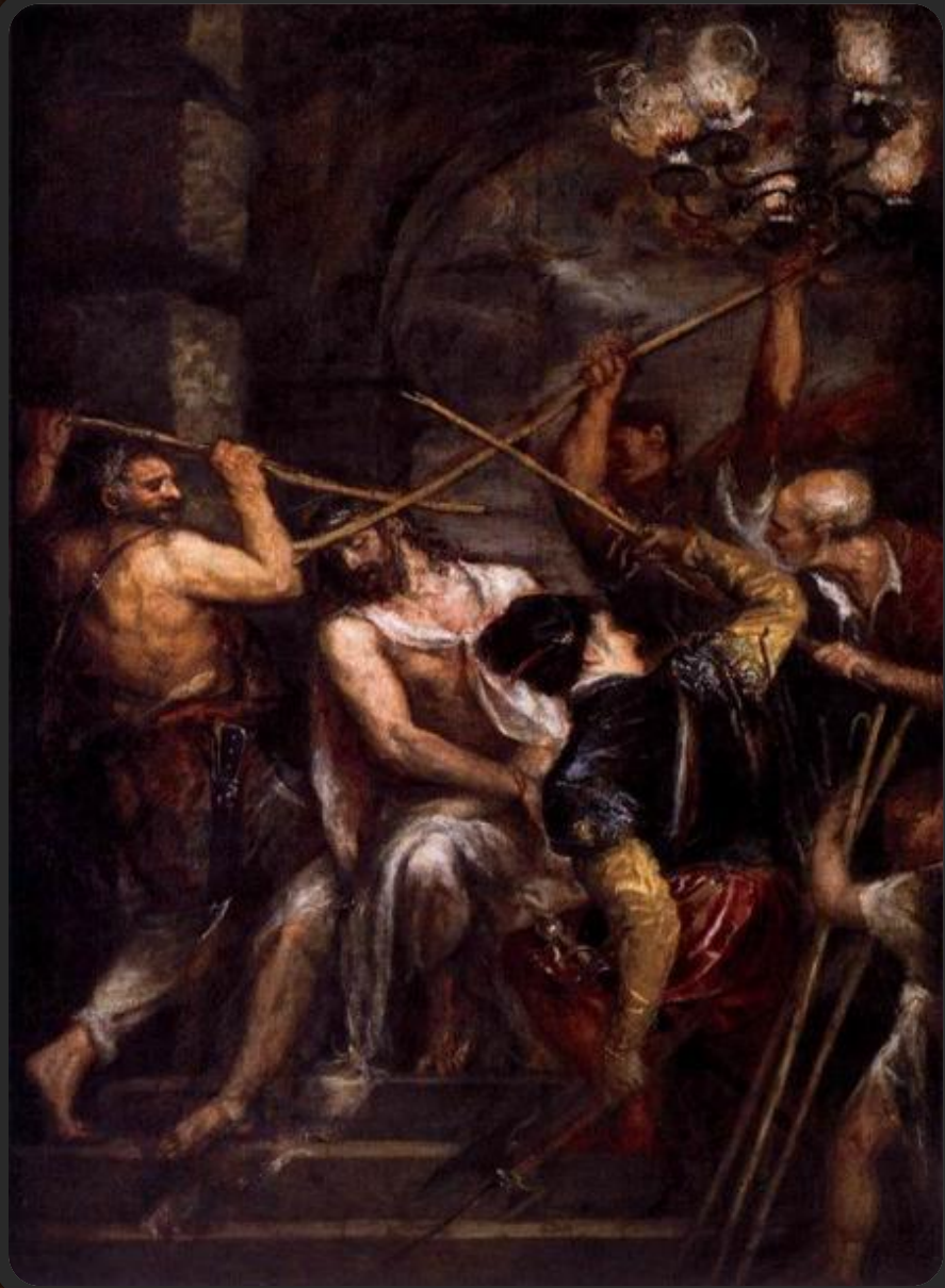
Коронование Христа терновым венцом (1542)

В парижской версии картины Коронование терновым венцом (Лувр) он использует резкие диагональные построения и тесно сгруппированные фигуры, чтобы передать эмоциональное напряжение, а через него – силу физического страдания Христа.