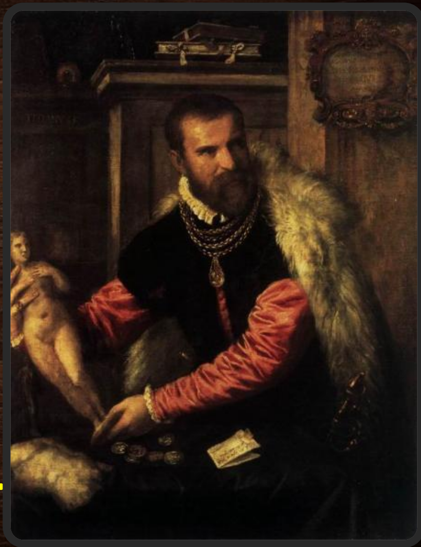
Портрет Якоба Страда

Портреты Тициана, исполненные в течение 1520-х годов, выглядят более камерными. Обычно, как в Мужском портрете (Лондон, Национальная галерея), в них акцентируются черты личности модели.