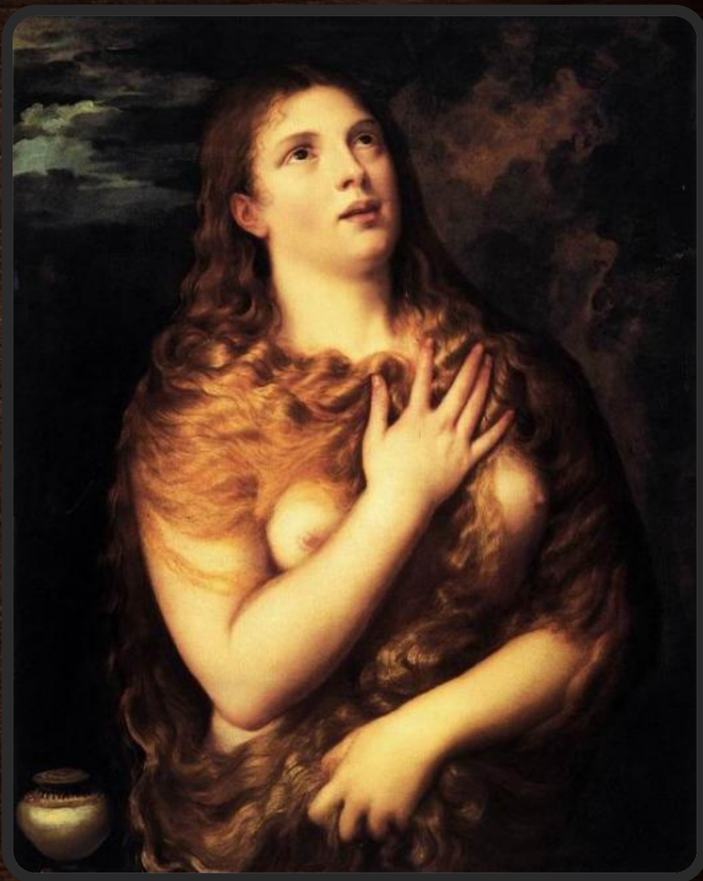
Святая Мария Магдалина

В 1530-е годы Тициан создает полотна, совершенные с точки зрения живописной техники. Картина Введение Марии во храм (1534–1538, Венеция, галерея Академии) для Скуола делла Карита представляет собой яркий, праздничный образ, в котором архитектура как будто образует обрамление для многочисленных портретных изображений. Это произведение вызывает в памяти городские виды и изображения венецианских праздников у Карпаччо и Джентиле Беллини и предвещает сцены пиров Веронезе.