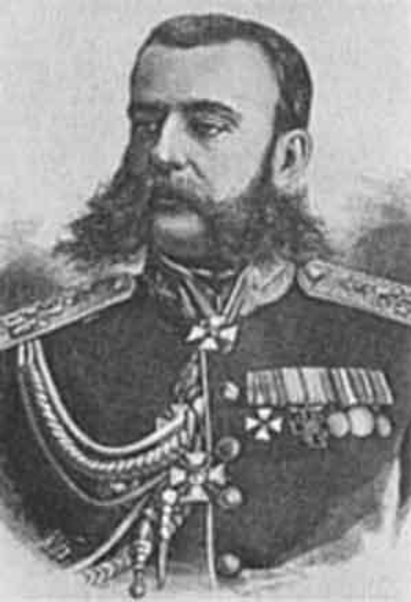
Генерал Скобелев М. Д.