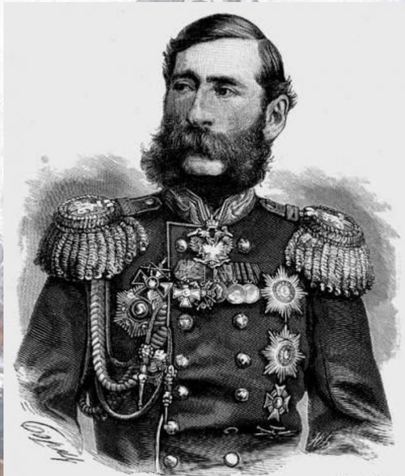
Генерал Лорис - Меликов