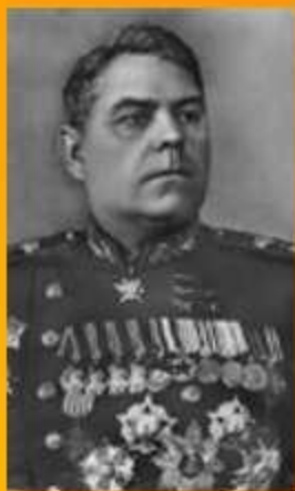
Василевский А.М., представитель Ставки