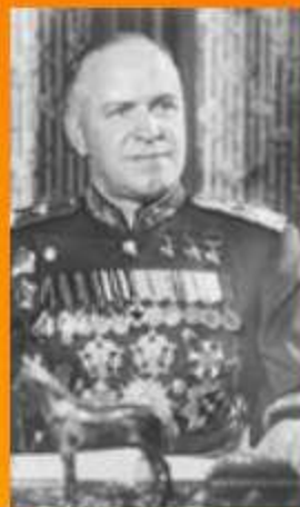
Жуков Г.К. представитель Ставки