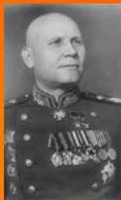
Конев И. С., командующий Степным фронтом