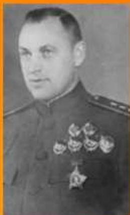
Рокоссовский К.К., командующий Центральным фронтом