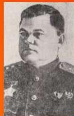
Н.Ф. Ватулин, командующий Воронежским фронтом