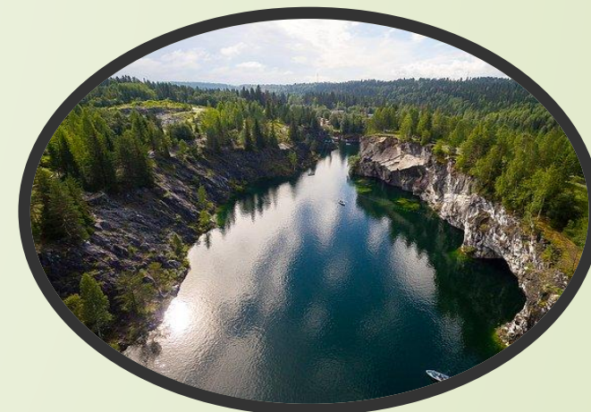
Горный парк «Рускеала»