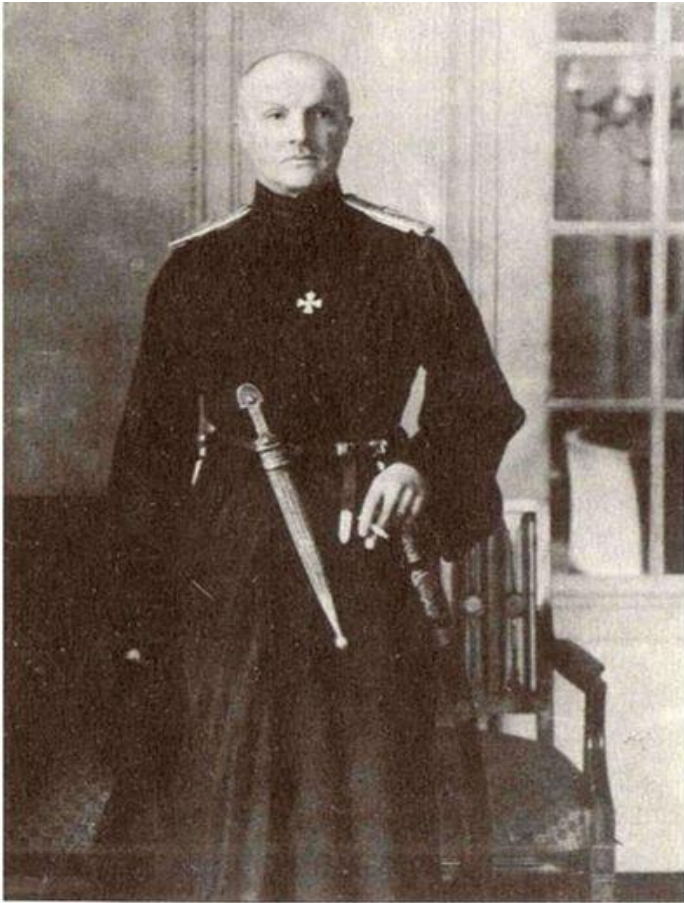
2. Гетьман Павлю Скоропадський у 1918 р.