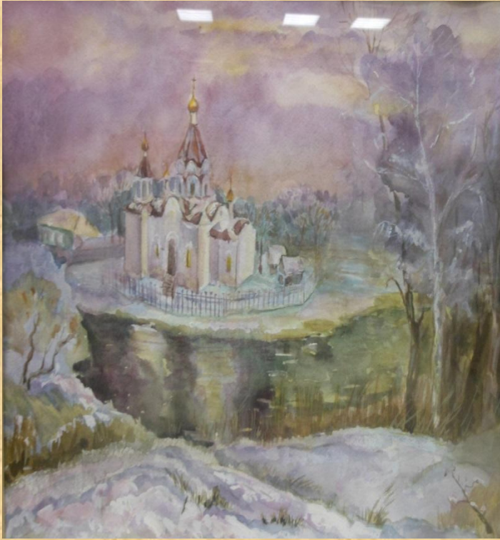
Гречнева Н.В. Храм Иверской иконы Божьей Матери Б., акв. 2015 Б., акв. 2015