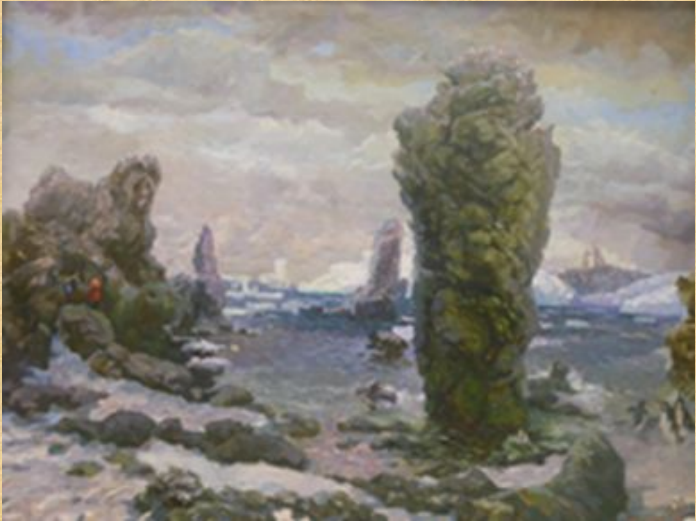
Дрилев А.А. Антарктида Х., м. 2005г