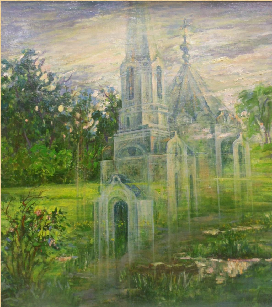
Леденева И.А. Мираж. Храм Воскресения Христова в Колывани.