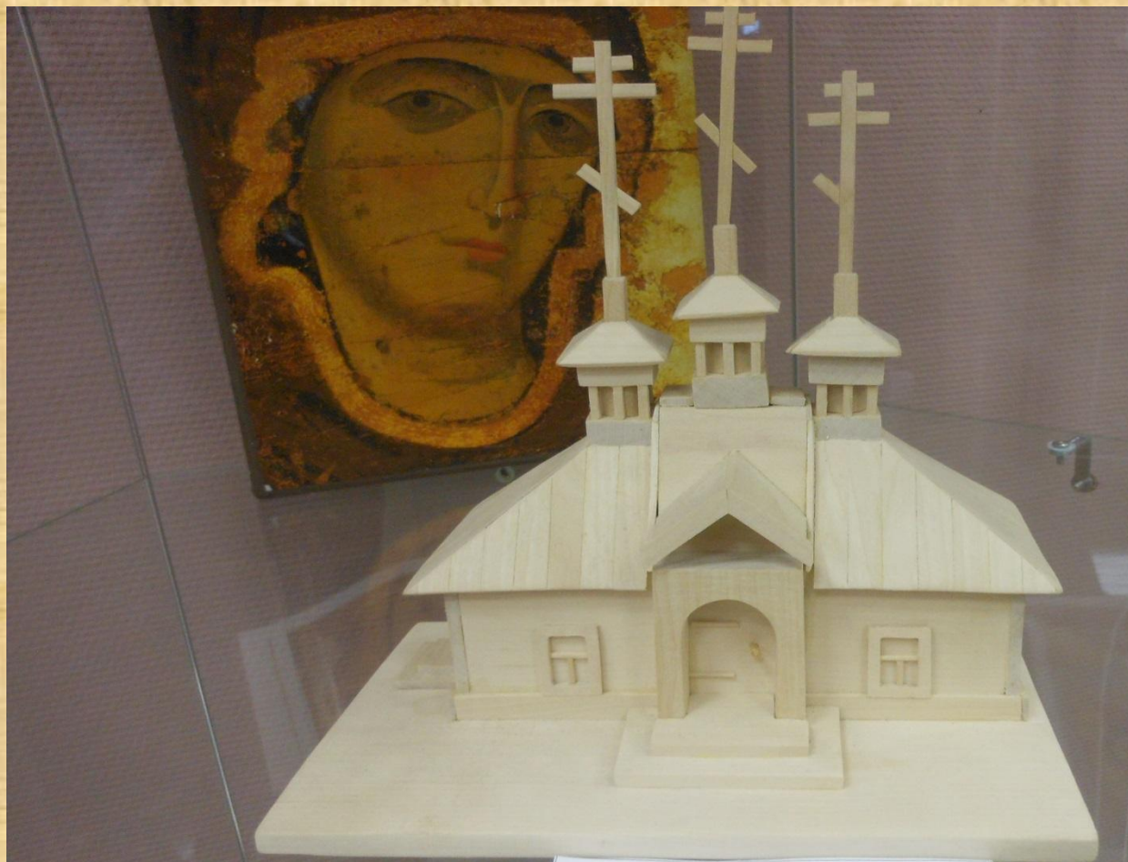
Малыгин В. Н. Церковь трёх купольная (дерево, макет)