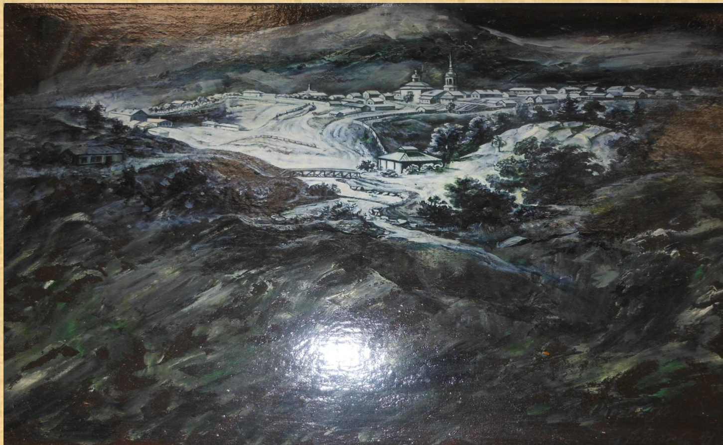
Леденева И.А. Снежная Колывань Х.,м. 1997г.