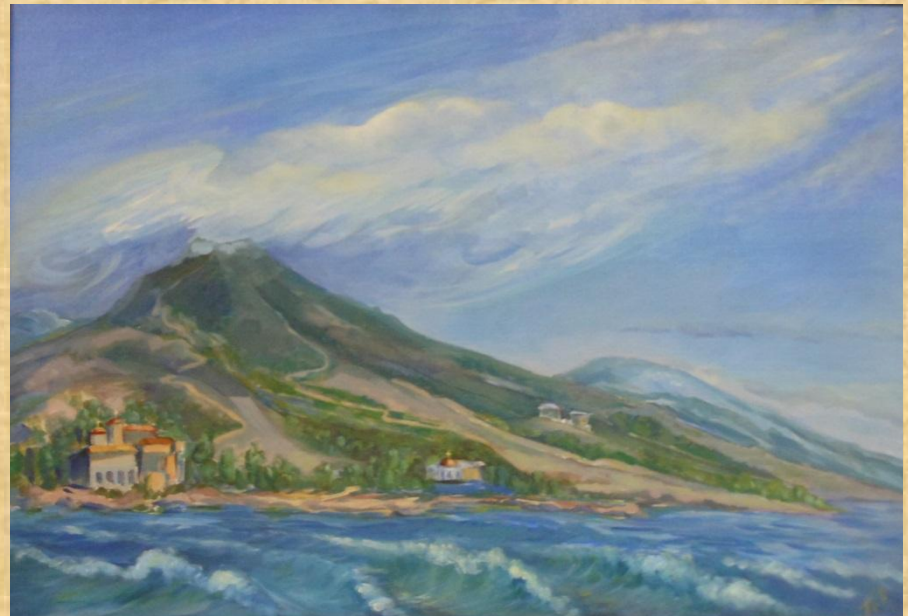
Гречнева Н.В. Крыло ангела (Греция, гора Афон) Х., м. 2013г.