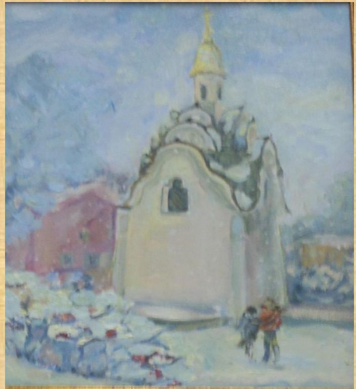
Гречнева Н.В. Часовня при храме Дмитрия Ростовского Б., акв., гуашь. 2011г.