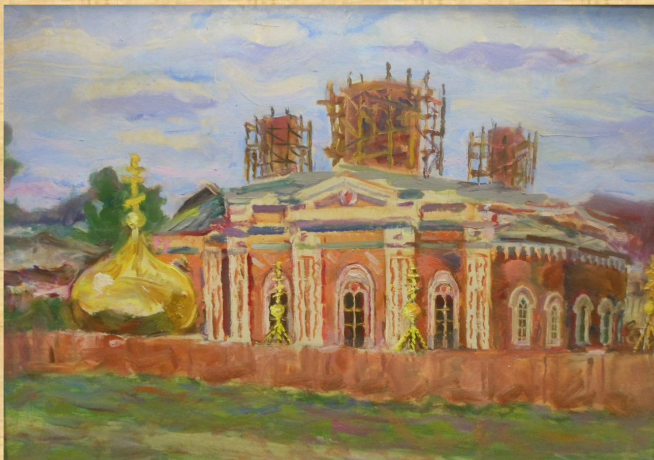
Шубин В.С. Будут новые купола к., м.