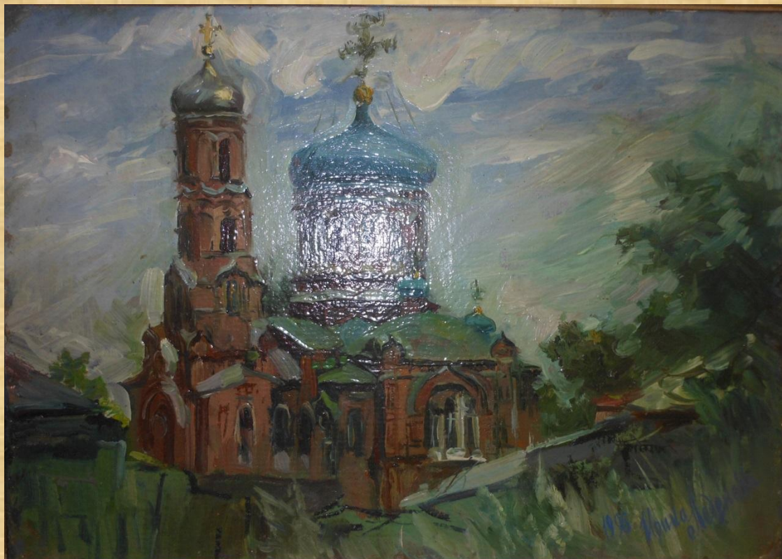
Леденева И.А. Покровский собор