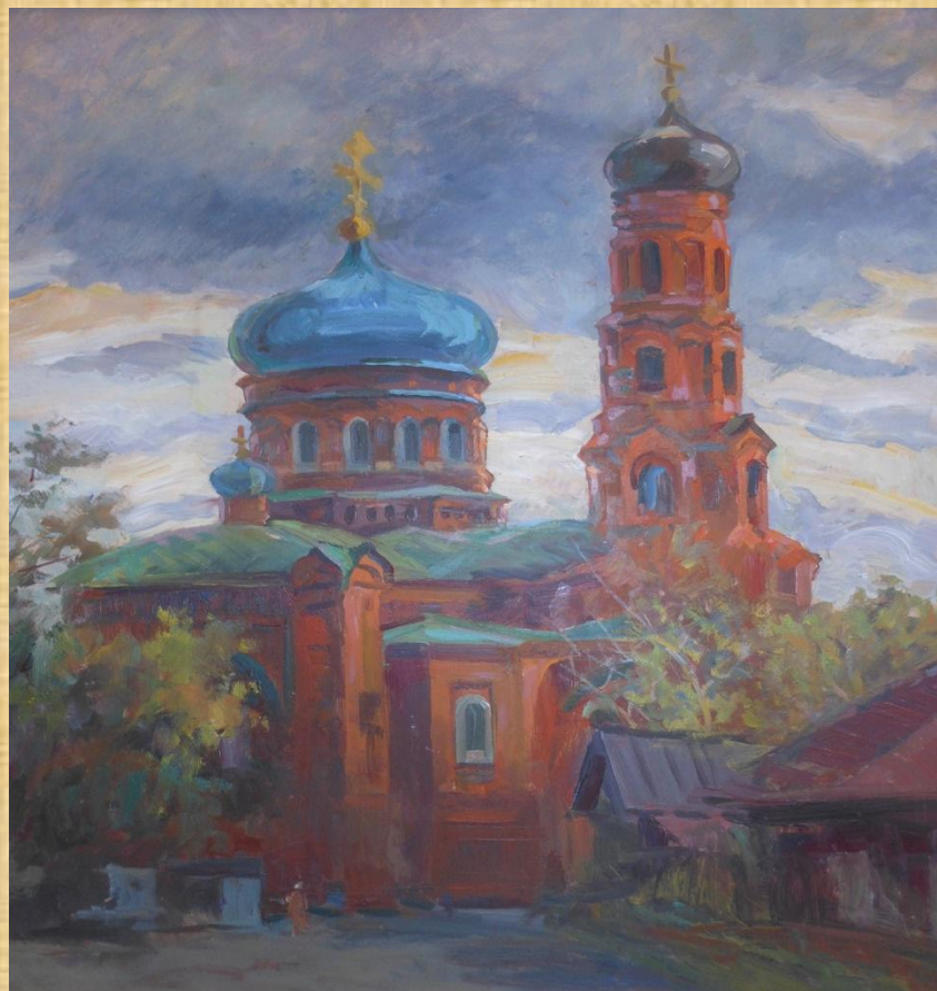
Шубин В.С. Покровский собор к., м.