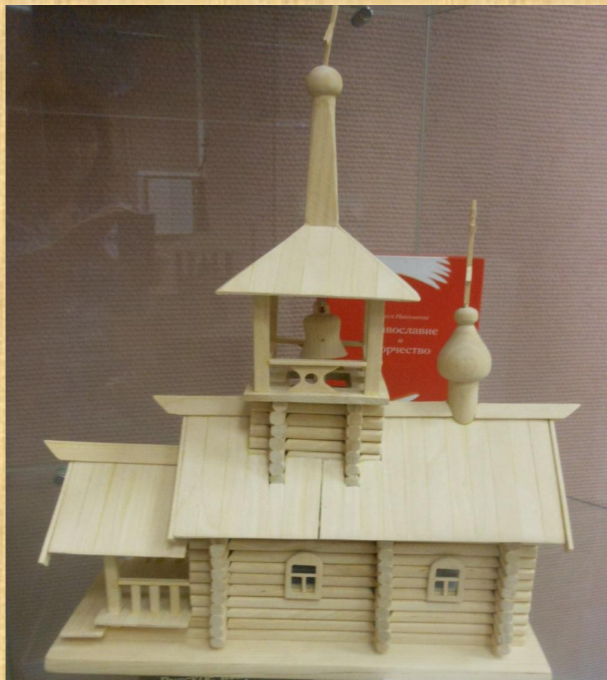
Мальгин В. Н. Часовня со звонницей 18 век (дерево, макет)