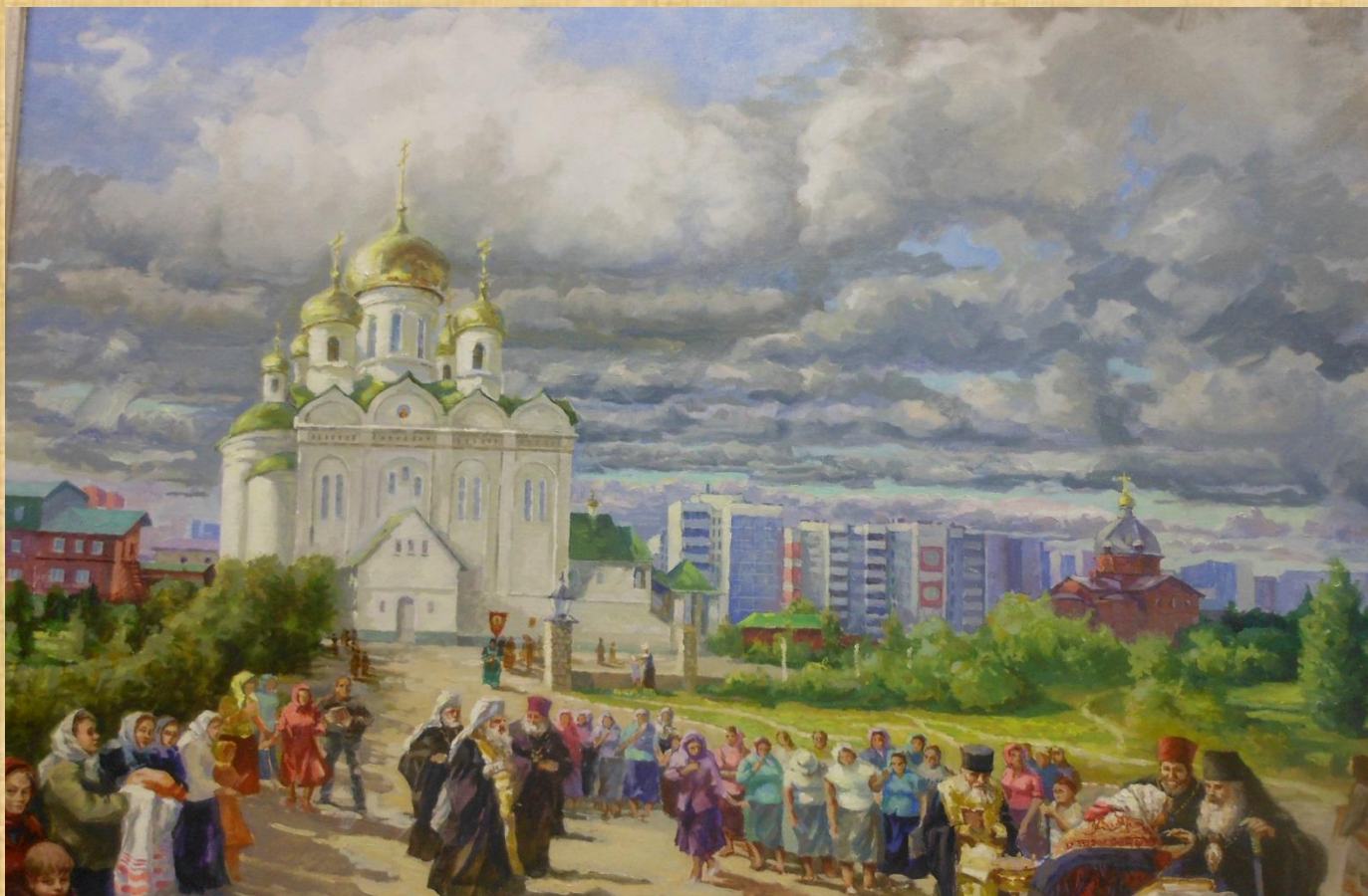
Дрилев А.А. Храм Иоанна Богослова Х., м. 2016г.