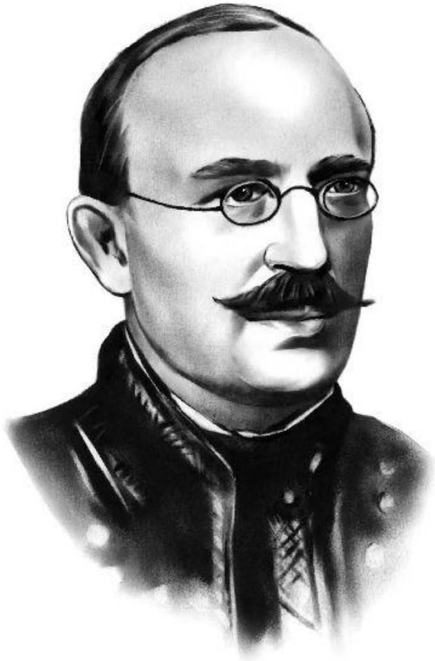
Осип Юрій Федькович