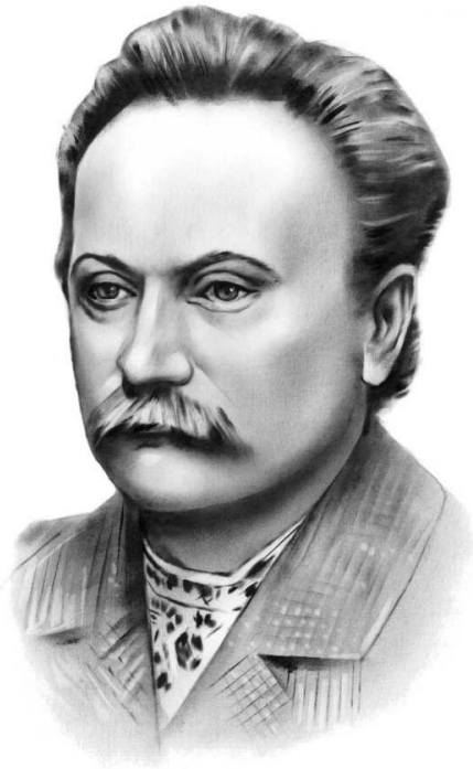
Іван Франко (1856—1916)