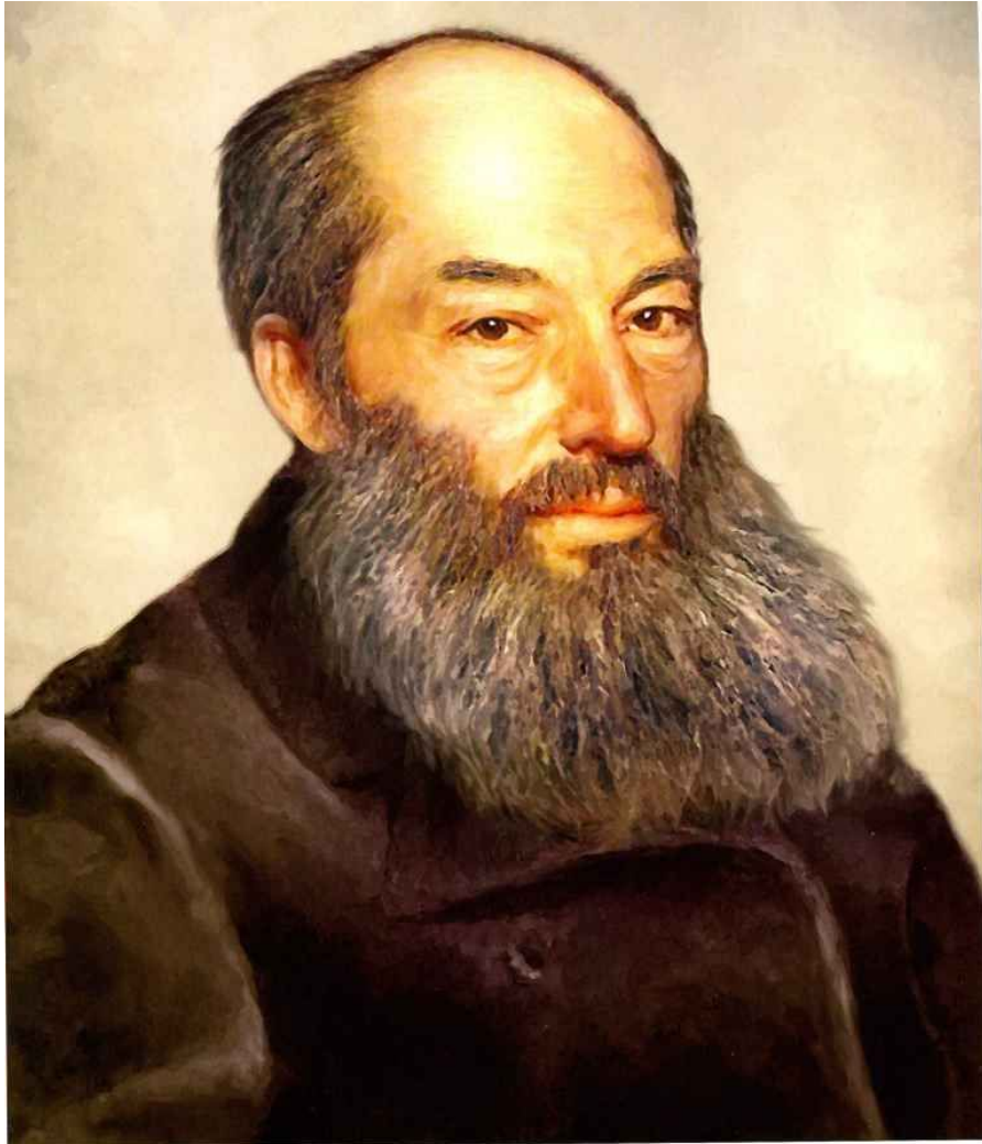
АФАНАСИЙ АФАНАСЬЕВИЧ ФЕТ