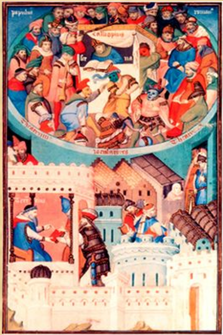
Фронтиспис рукописи с комедиями Теренция

Ремесленники готовили оформление: повозки и помосты, декорации, реквизит и костюмы. Каждый цех готовил один эпизод. Цеха оформляли и ставили сцены каждый по своему профилю. Судостроители — Ноев ковчег, оружейники — изгнание из рая. За несколько дней до показа устраивали смотр, или парад, мистерии: шествие в костюмах и показ декораций. В дни представления мистерии город был украшен и заперт, она могла длиться от трех до сорока дней. Мистерия тяготеет к площади. Площадь средневекового города сродни римскому форуму. Это соборное место. Средневековый человек боится одиночества: он привык жить на улице.