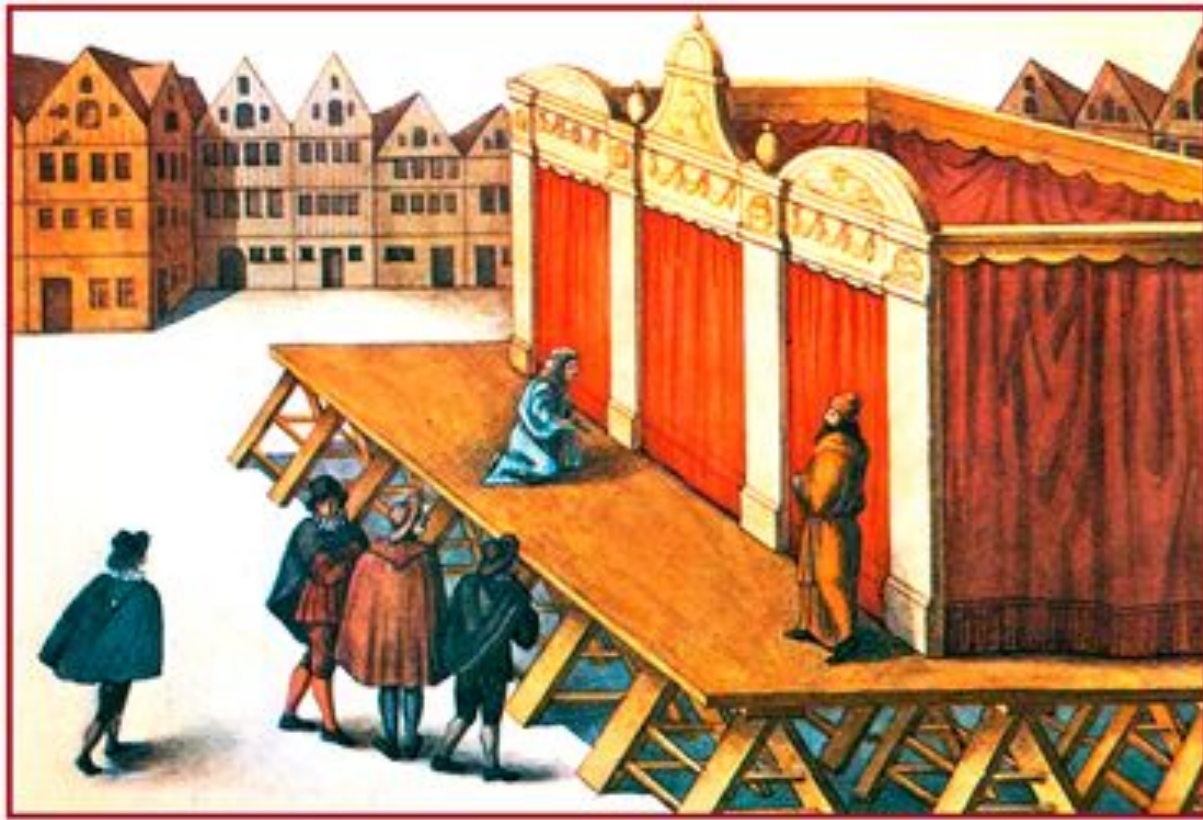
Площадной театр в Лувене Фландрия

Для всей культуры средневекового театра характерен принцип симультанных декораций (тип декорационного оформления спектакля, при котором декорации сменяются одновременно сменяемые по