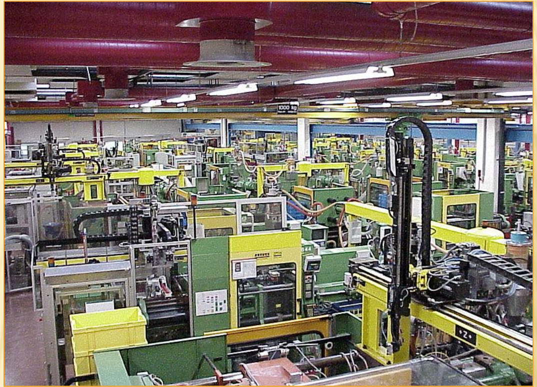
ЦЕХ ПО ПРОИЗВОДСТВУ КУБИКОВ LEGO