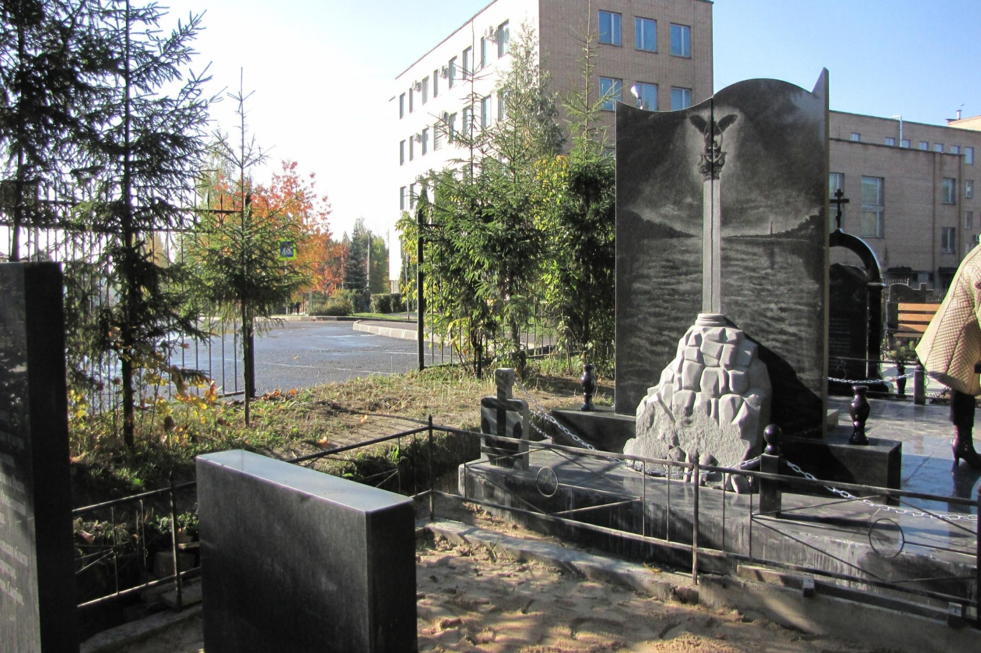
ОБРАТНАЯ СТОРОНА ПАМЯТНИКА Э.Д.БАЛТИНА