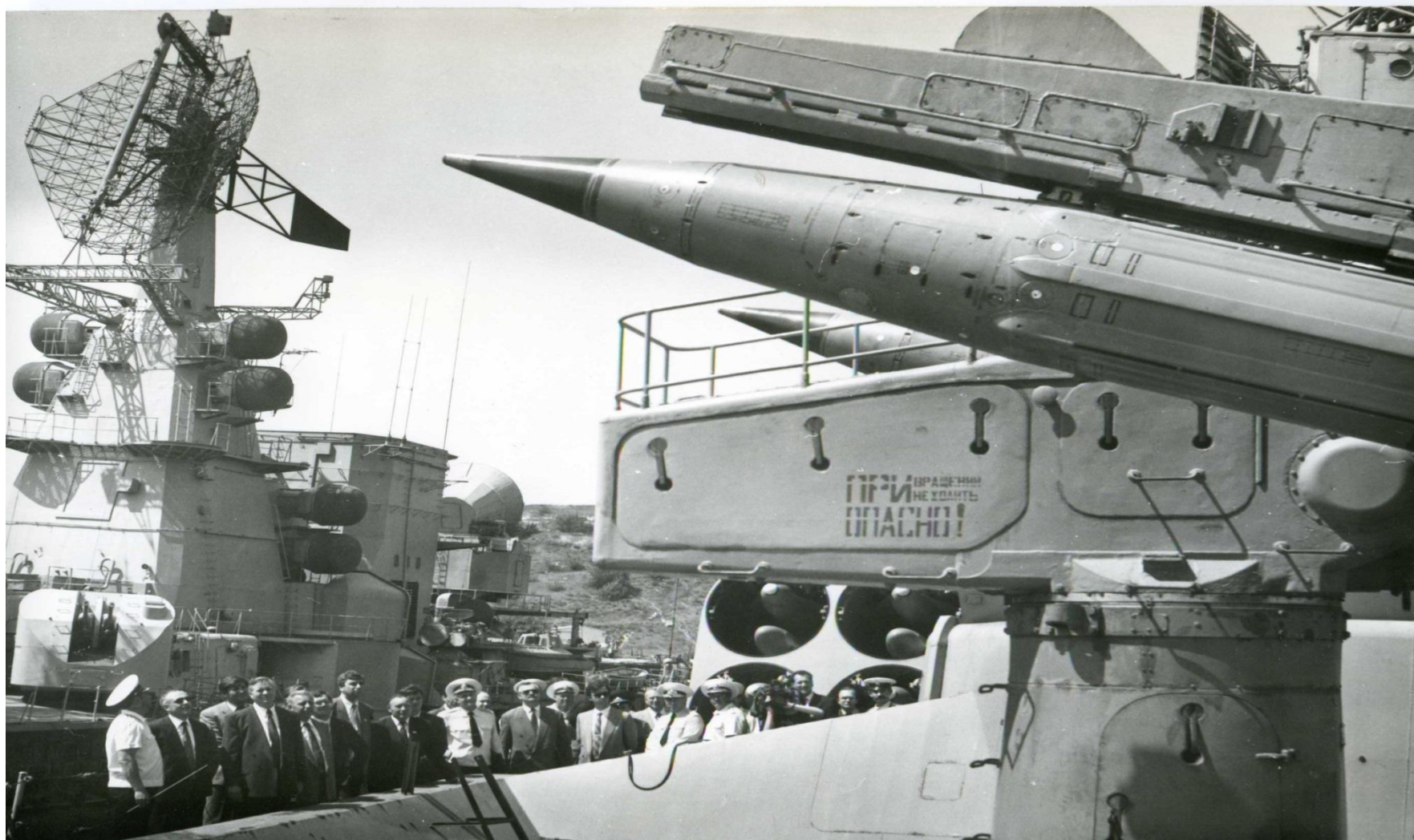
Правительственная делегация на кораблях Черноморского флота