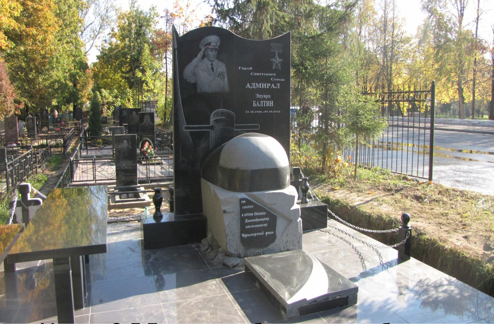
Могила Э.Д.Балтина на братском кладбище. Г. Смоленск