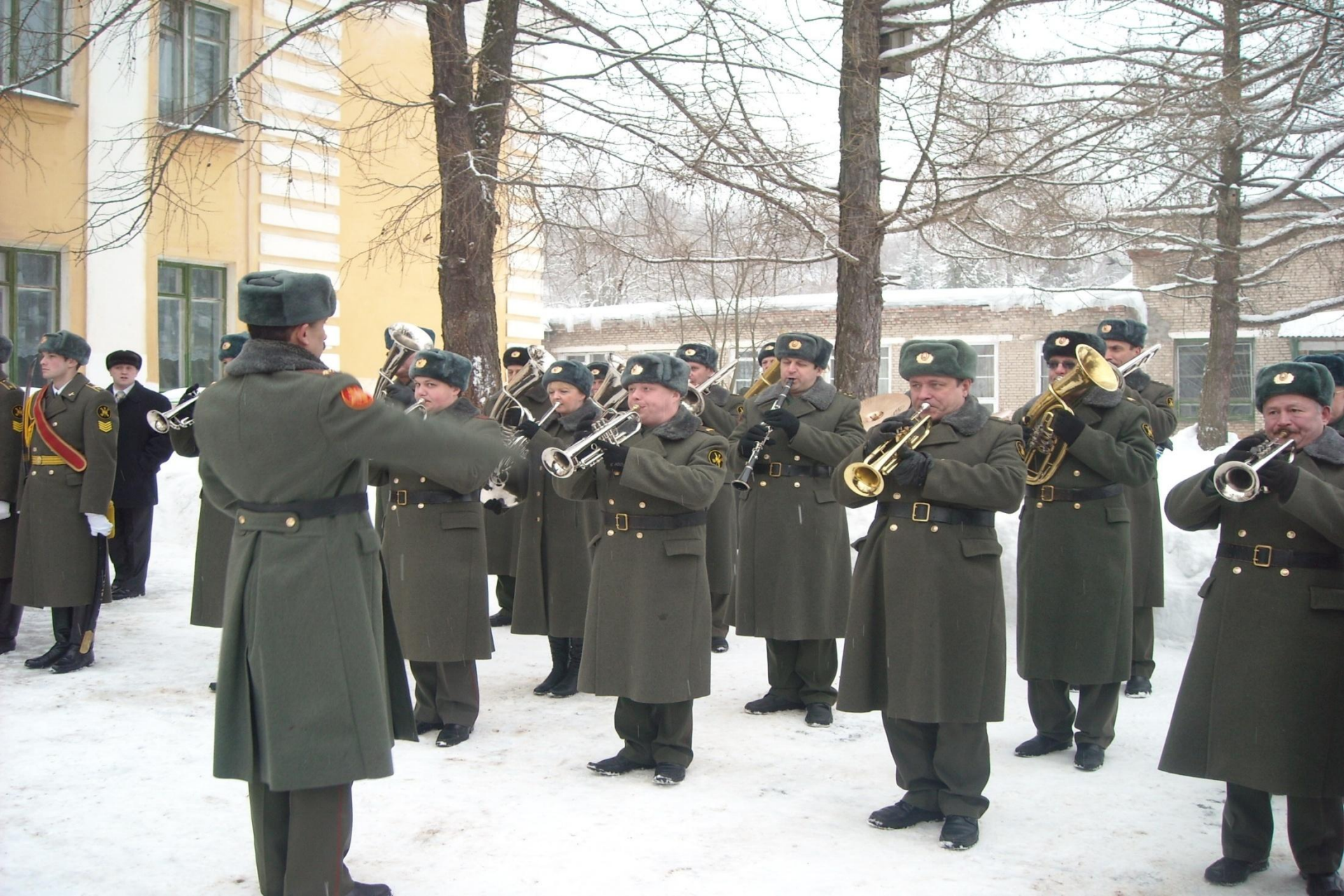
ВОЕННЫЙ ОРКЕСТР НА МИТИНГЕ, ПОСВЯЩЕННЫЙ ОТКРЫТИЮ МЕМОРИАЛЬНОЙ ДОСКИ