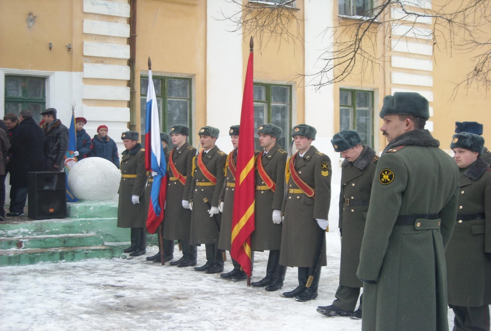
ЗНАМЕННАЯ ГРУППА ПЕРЕД НАЧАЛОМ МИТИНГА.