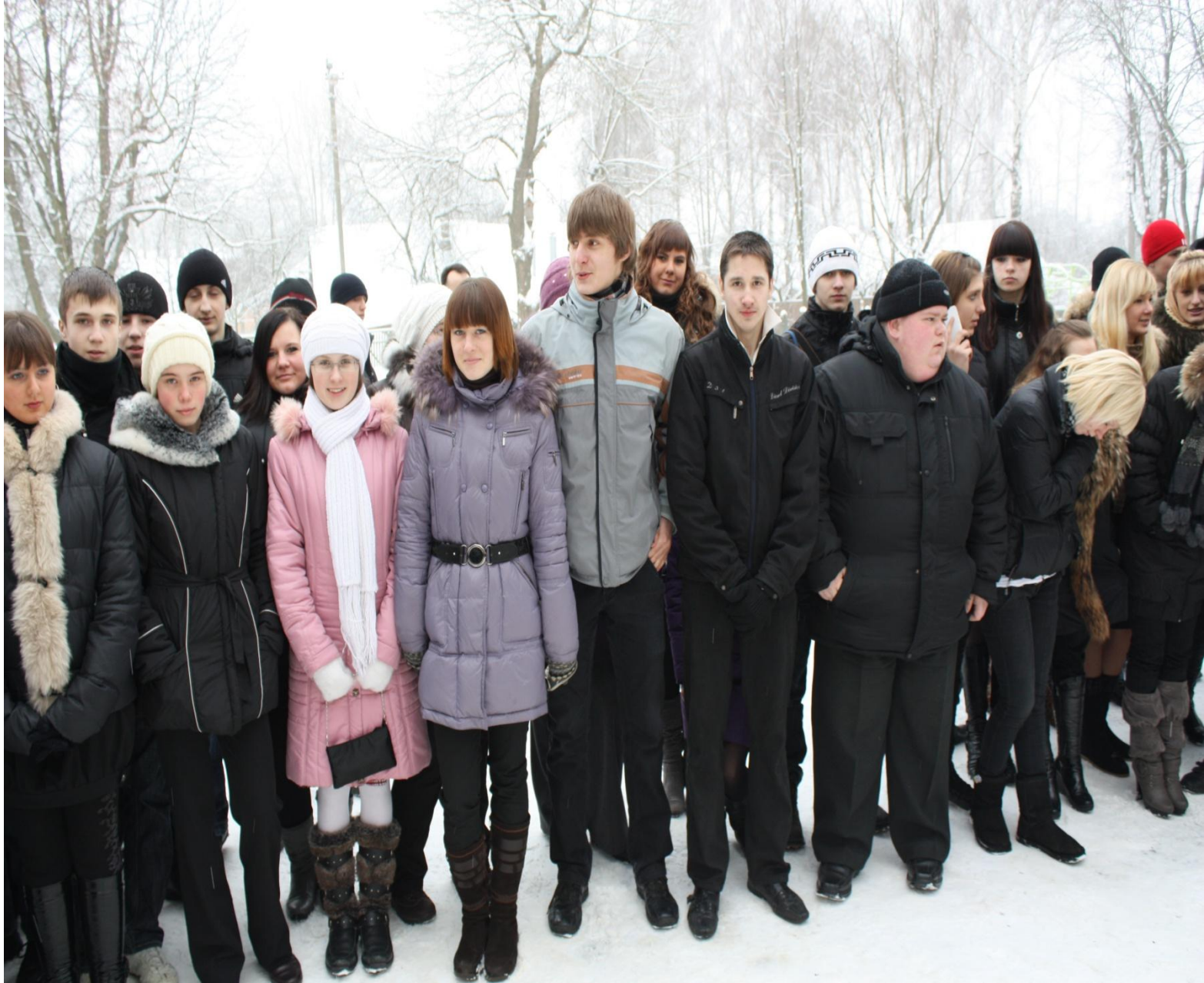
Учащиеся школы на митинге