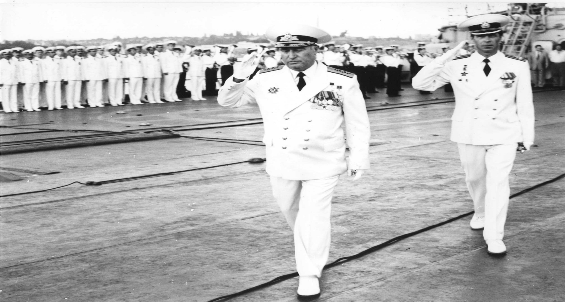
Адмирал Э.Д. Балтин принимает парад