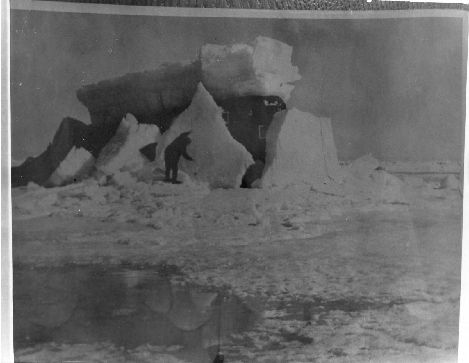
1981год. Испытания нового вида баллистических ракет. Подводная лодка К-476, проламывает лед толщиной 1м 80см.