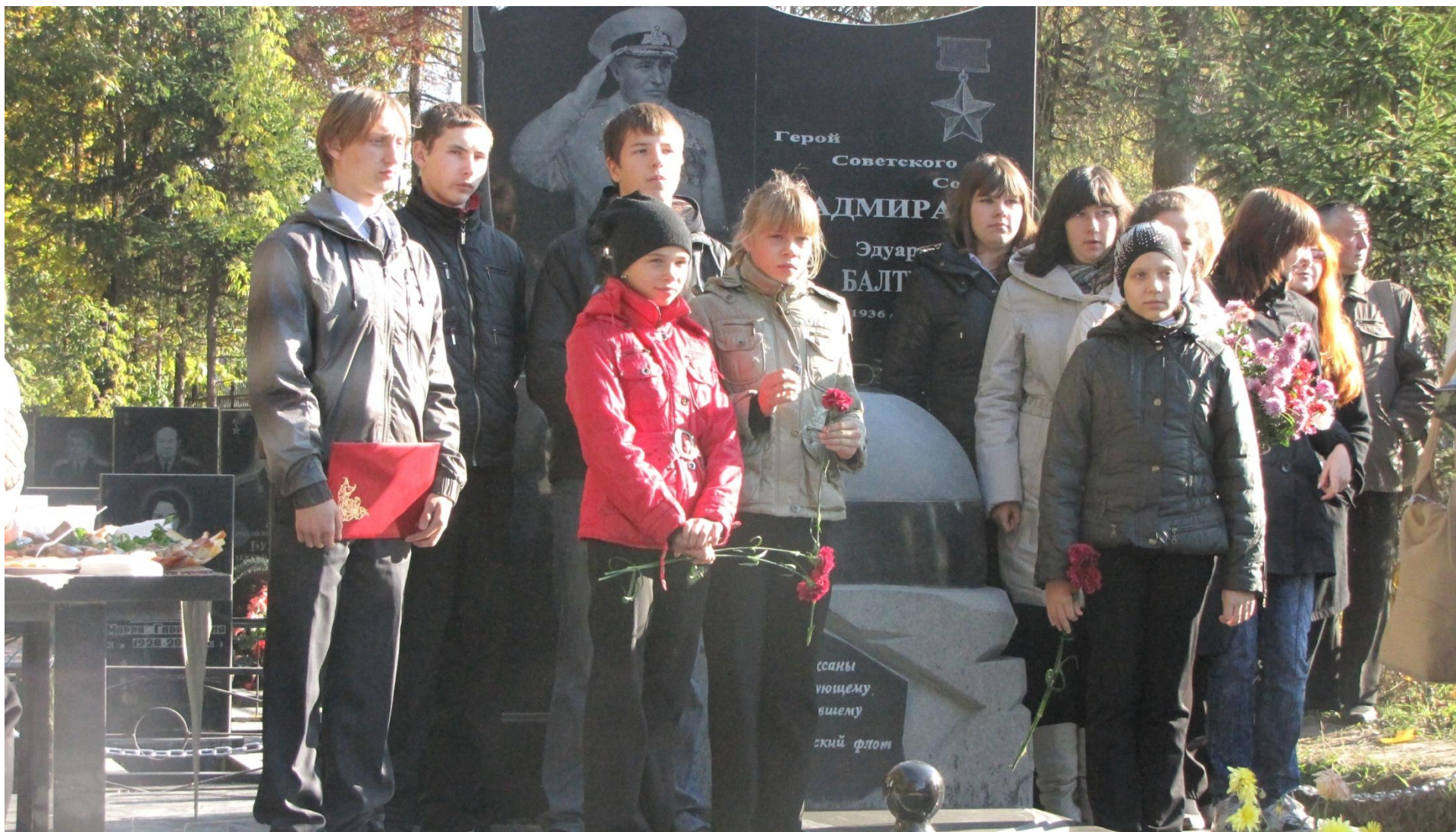
УЧАЩИЕСЯ МБОУ СОШ №13 ИМЕНИ Э.Д. БАЛТИНА У ЕГО МОГИЛЫ