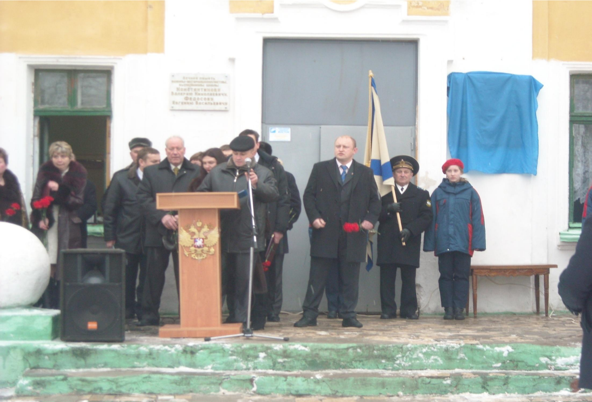
Митинг, посвященный открытию мемориальной доски на здании нашей школы (19.02.2010г)