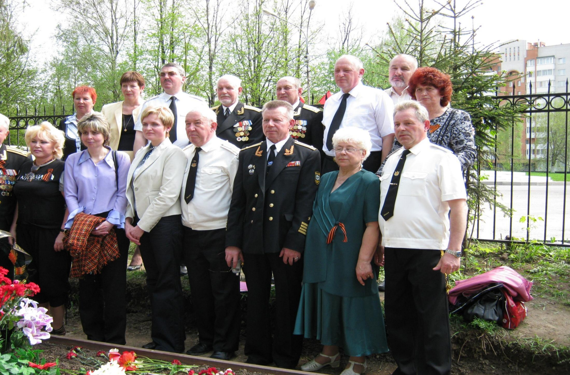
Годовщина со дня смерти Э.Д.Балтина