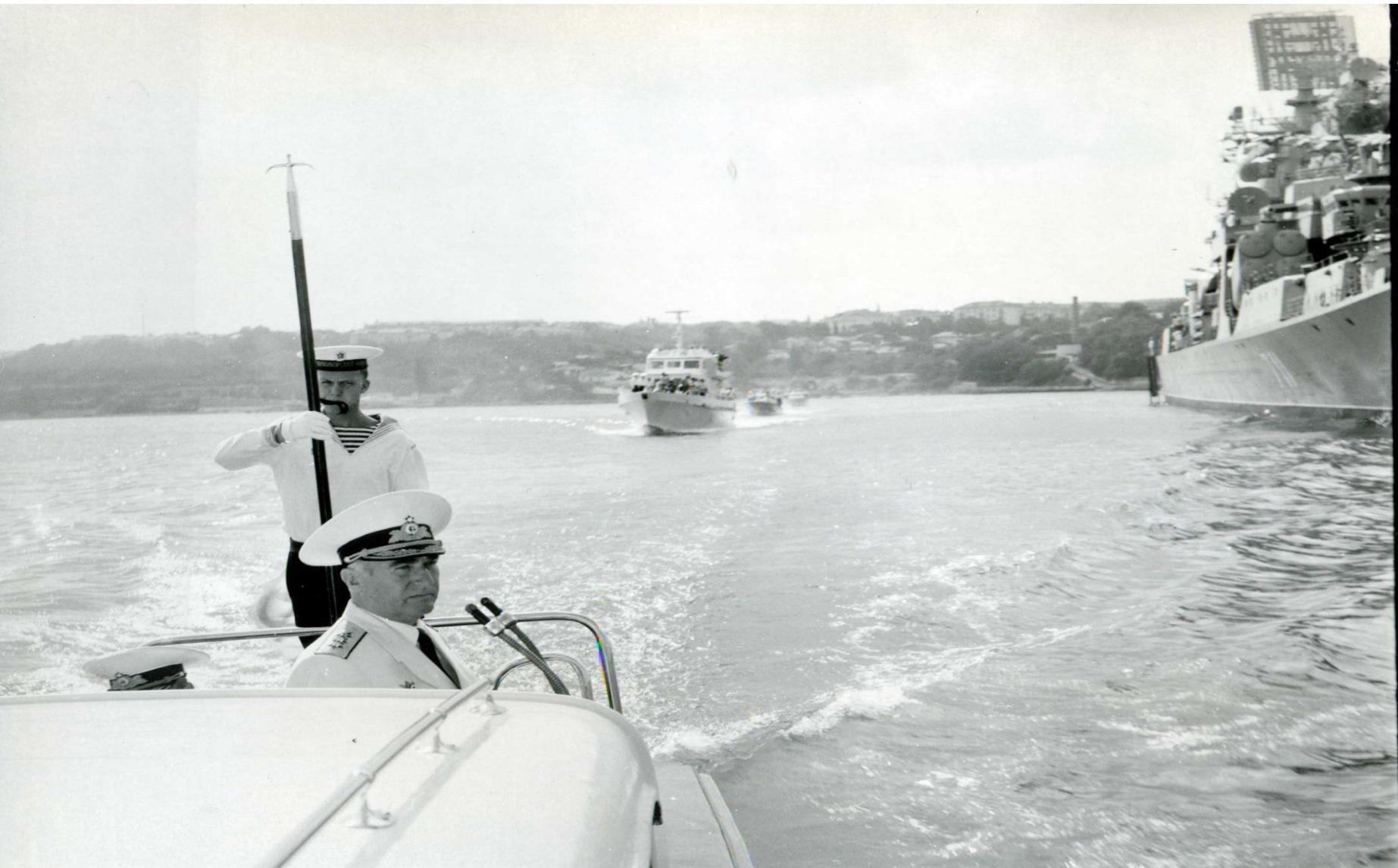
Адмирал Э.Д. Балтин объезжает парад кораблей Черноморского флота