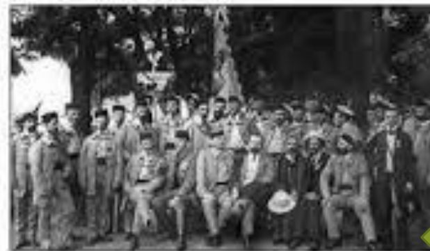
Українські «соколи» в Празі під час все-слов'янського сокільського здигуну 1912 р.