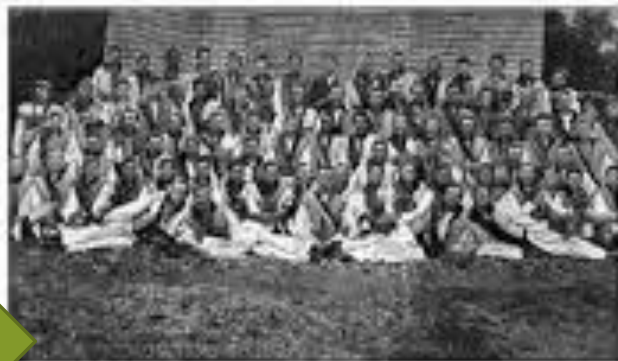
Учасники товариства «Січ» в Іллінцях