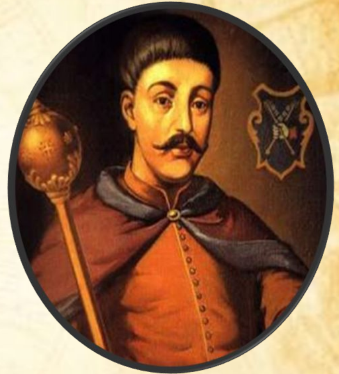
Іван Брюховецький – гетьман Лівобережної України 1663-1668 рр