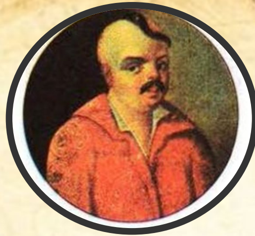
Яким Сомко – гетьман Лівобережної України в 1662 р, якого не визнала Москва