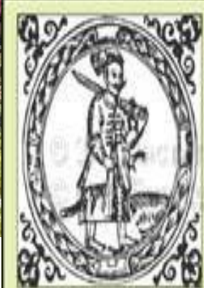
ГЕРБ УКРАЇНСЬКОЇ КОЗАЦЬКОЇ ДЕРЖАВИ