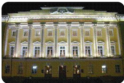
Конституционный Суд РФ

Судебный орган конституционного контроля. Обеспечивает соблюдение Конституции РФ, проверяет законы, принятые Федеральным Собранием и региональными органами законодательной власти на соответствие Конституции