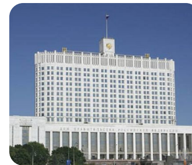
Здание Правительства РФ