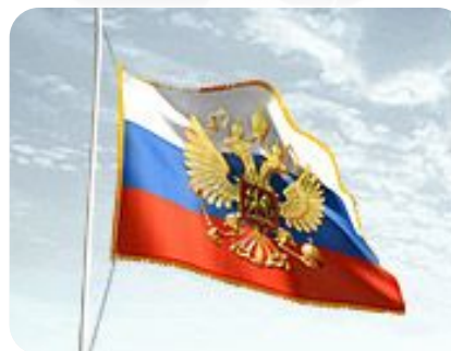
Штандарт Президента России

Обладает правом законодательной инициативы, утверждает законы, принятые Федеральным Собранием РФ