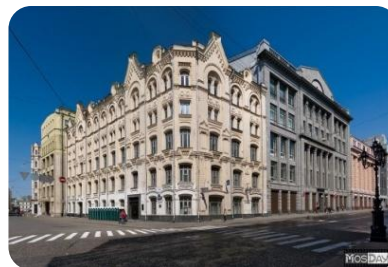
Верховный суд РФ

Судебный орган конституционного контроля. Обеспечивает соблюдение Конституции РФ, проверяет законы, принятые Федеральным Собранием и региональными органами законодательной власти на соответствие Конституции