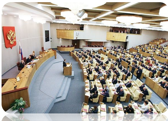
Зал заседаний Государственной Думы

Основная функция Государственной Думы – разработка и принятие федеральных законов