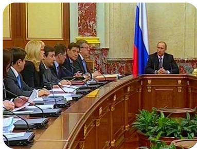
Заседание Правительства РФ