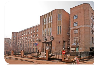
Высший арбитражный суд РФ

Суд высшей инстанции, в котором решаются все гражданские, административные и уголовные дела, не разрешенные в рамках рассмотрения дел судами нижних инстанций