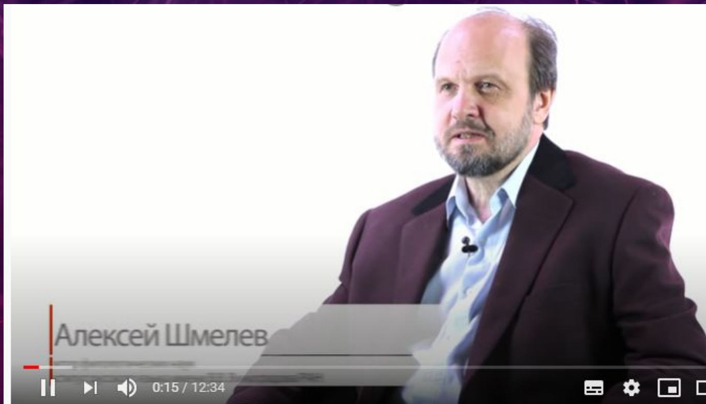
Русская языковая модель мира - Алексей Шмелев