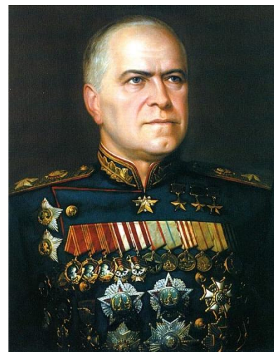
Г. К. Жуков