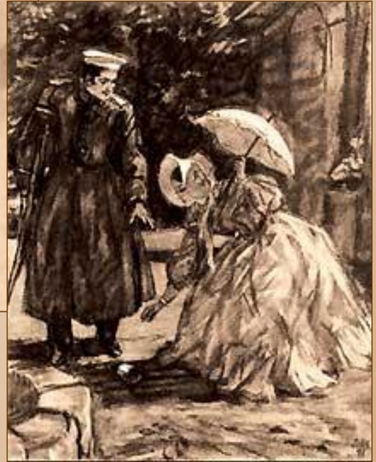
Мери и Грушницкий