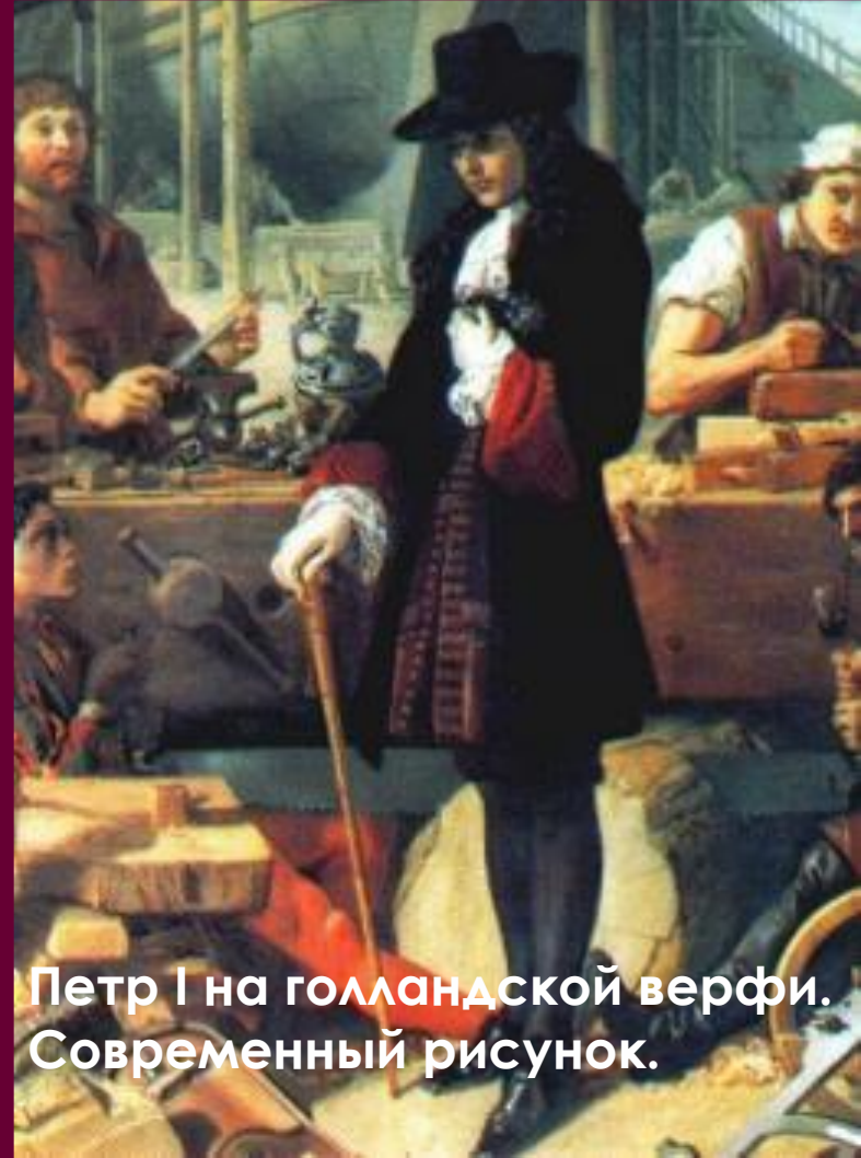
Петр I на голландской верфи. Современный рисунок.

Петр заботился о привитии хороших манер среди бояр, обучал из правилам этикета.