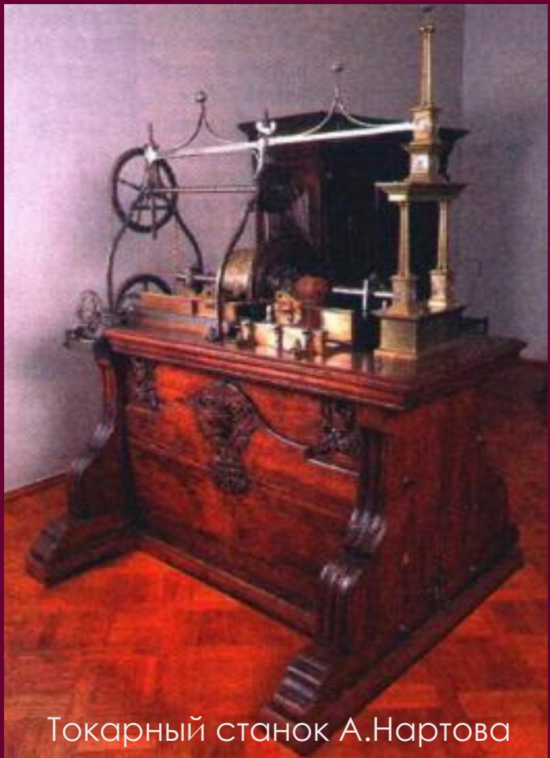
Токарный станок А.Нартова

Развитие экономики способствовало разви- тию науки.