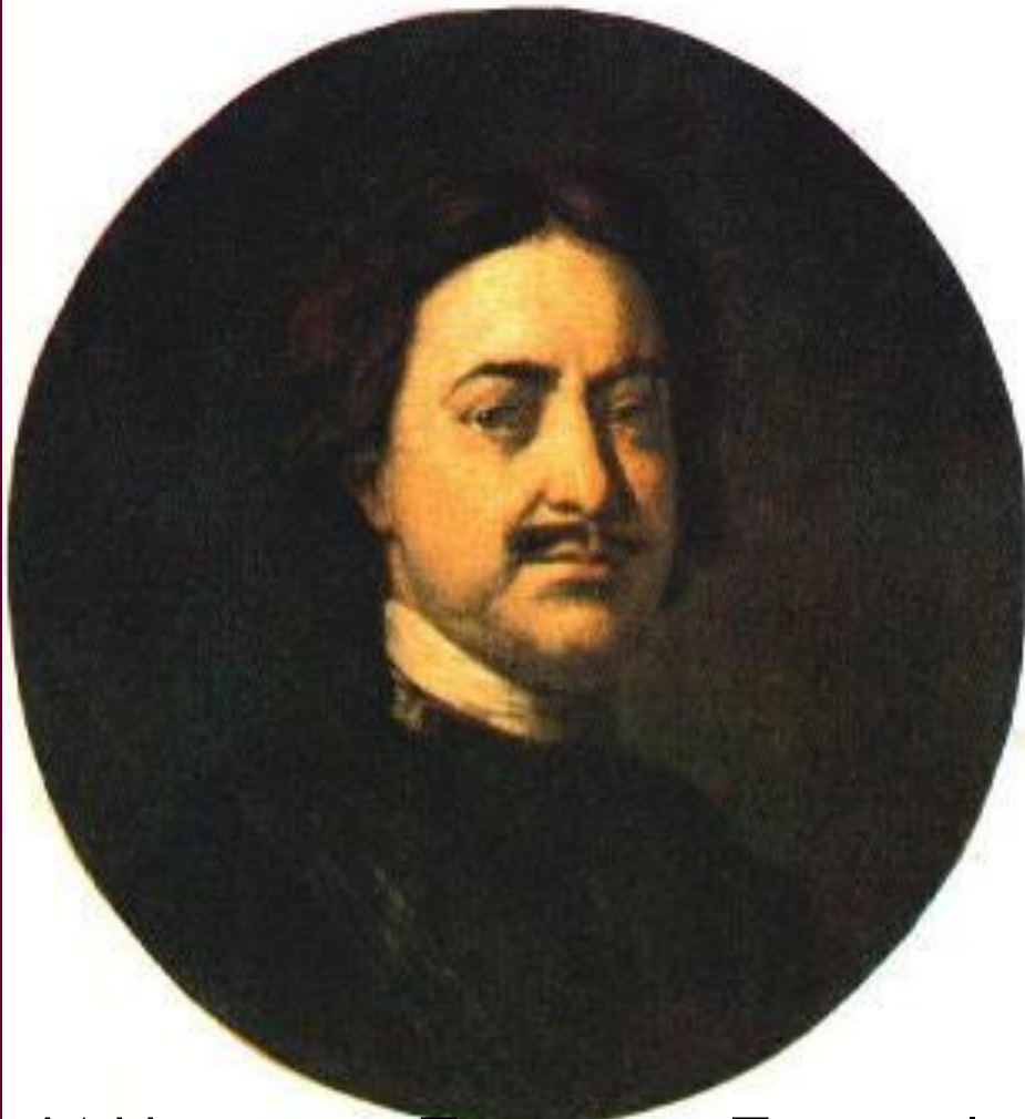
И.Никитин Портрет Петра I.

В начале 18 в. художественная культура приобрела светский характер и получила поддержку государства.