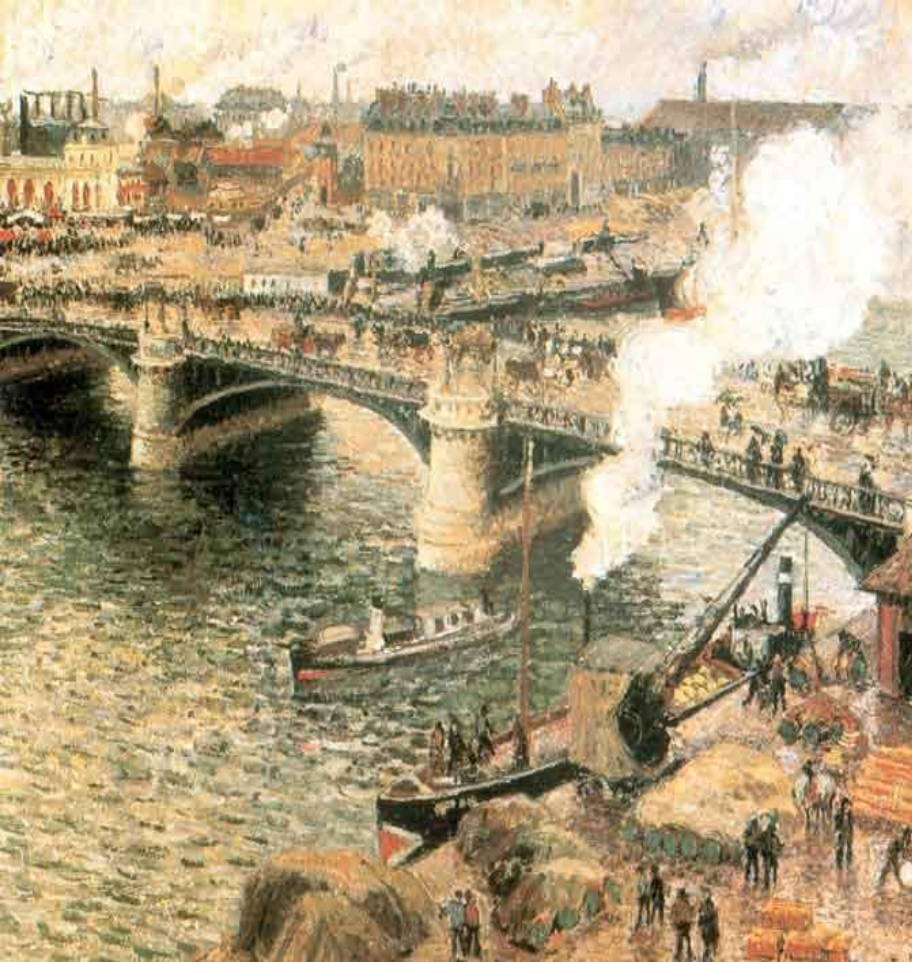
К. Піссарро. Міст в Руані. Дощовий день