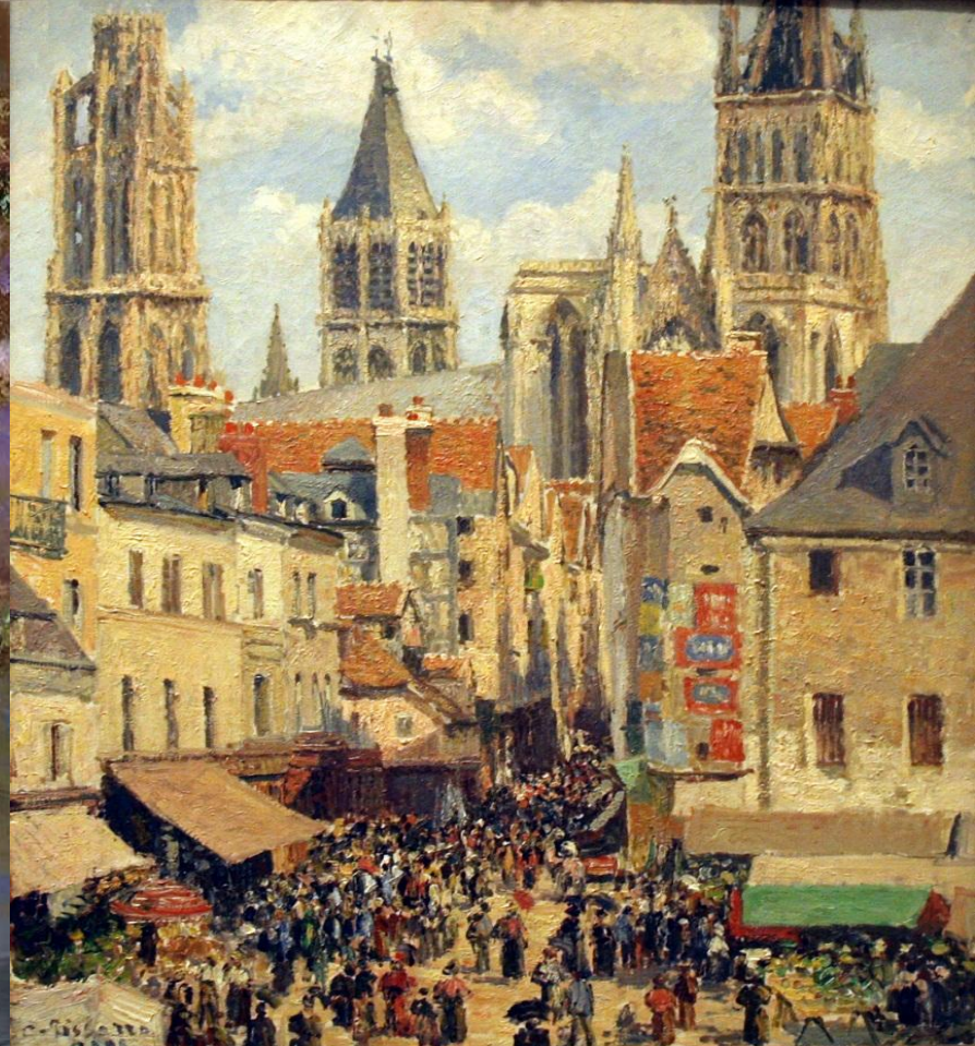
Руан, вулиця Епісері. Ефект сонячного освітлення