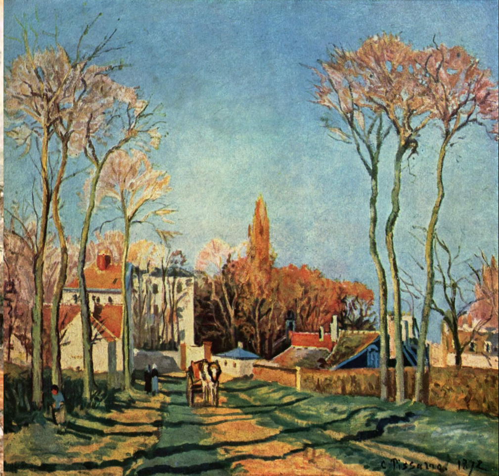
К. Піссарро Село Вуазен