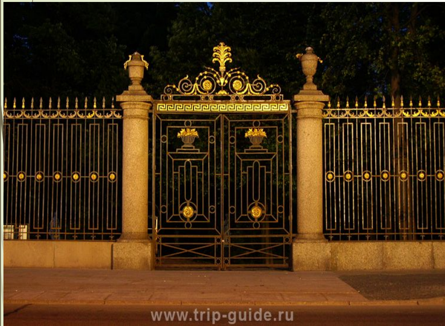
Решётка Летнего сада