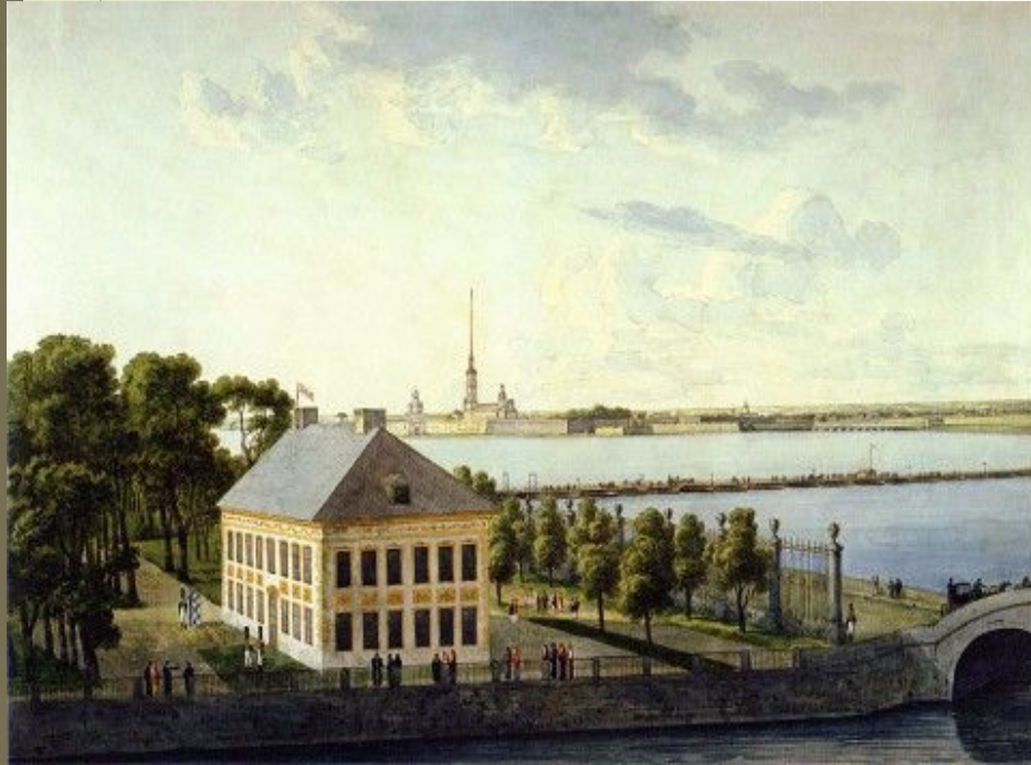
Летний дворец Петра Первого