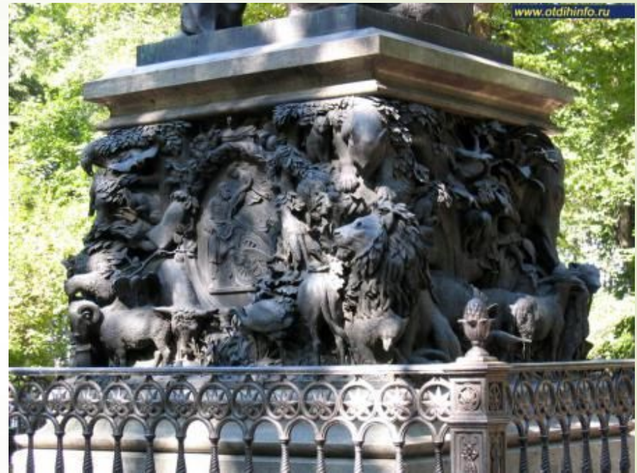
Барельеф памятника И. А. Крылову