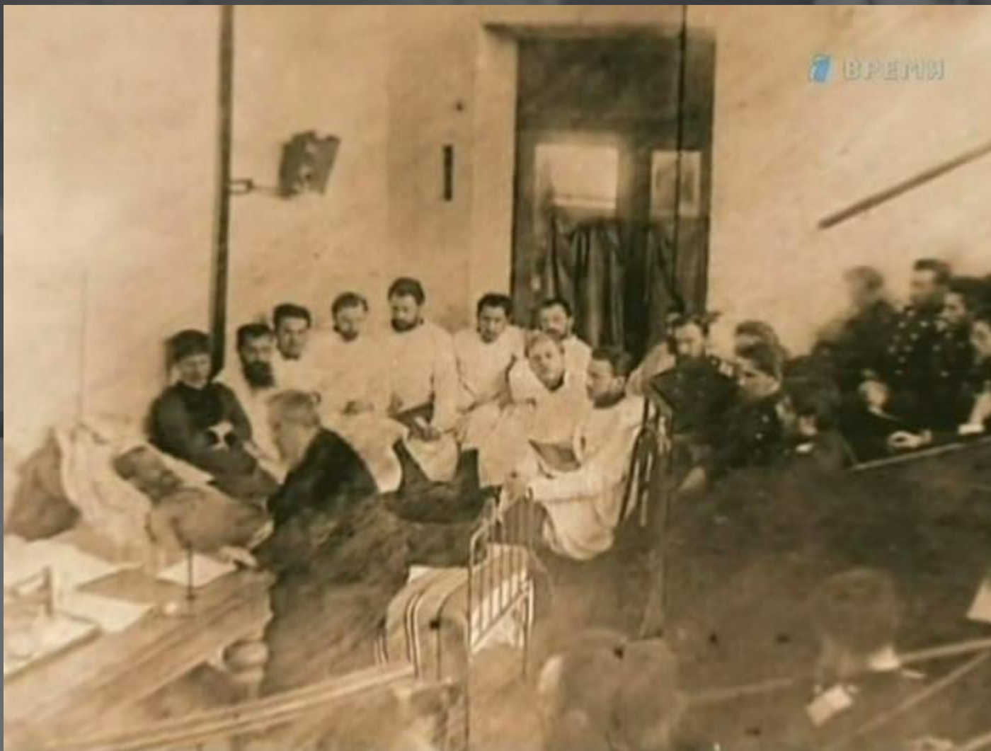
В 1866 и 1867 гг. работал в Германии в патологоанатомическом институте профессора Вирхова и хирургической клинике профессора Лангенбека; в прусской армии работал на перевязочных пунктах и в военном лазарете.