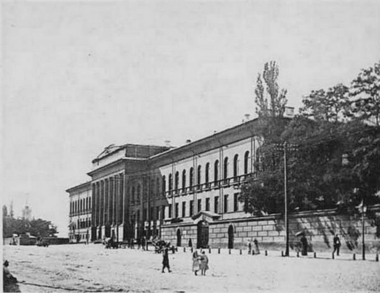
Кієвъ.—Университетъ Св. Владиміра.

По возвращении в Россию выпустил целую серию трудов, благодаря которым в начале 1870 г. был приглашен на кафедру хирургии в киевский университет.