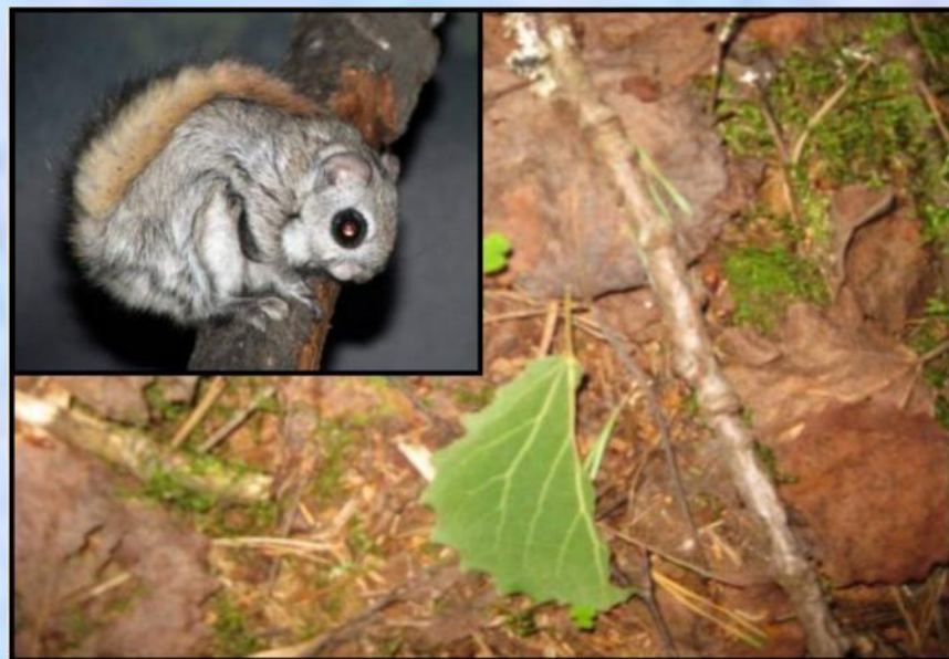
Отгрызенный лист осины – указание на пребывание летяги ( Pteromys volans )