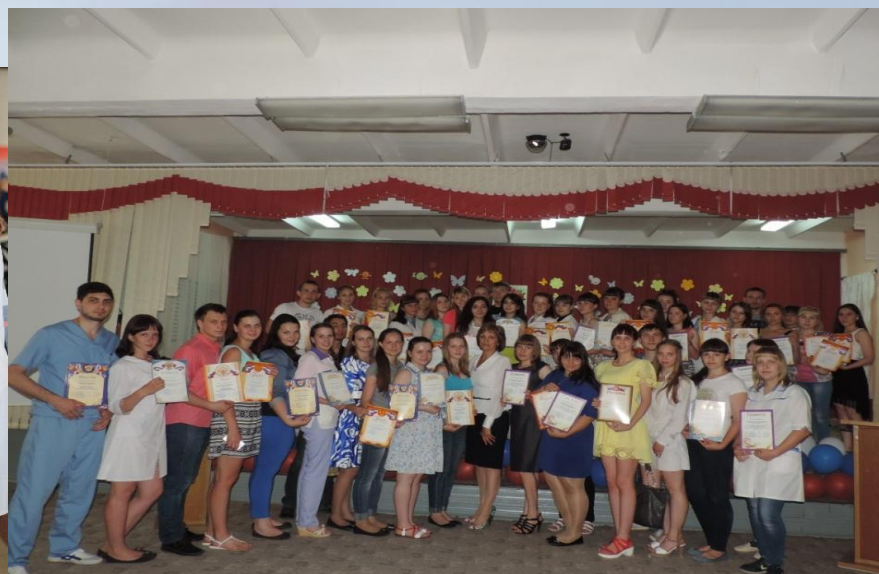
Здесь учусь, и мне это нравится!