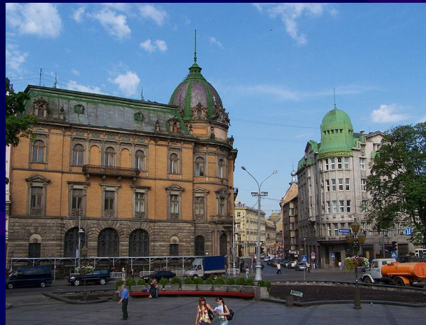
Міська забудова на пр. Свободи, Львів