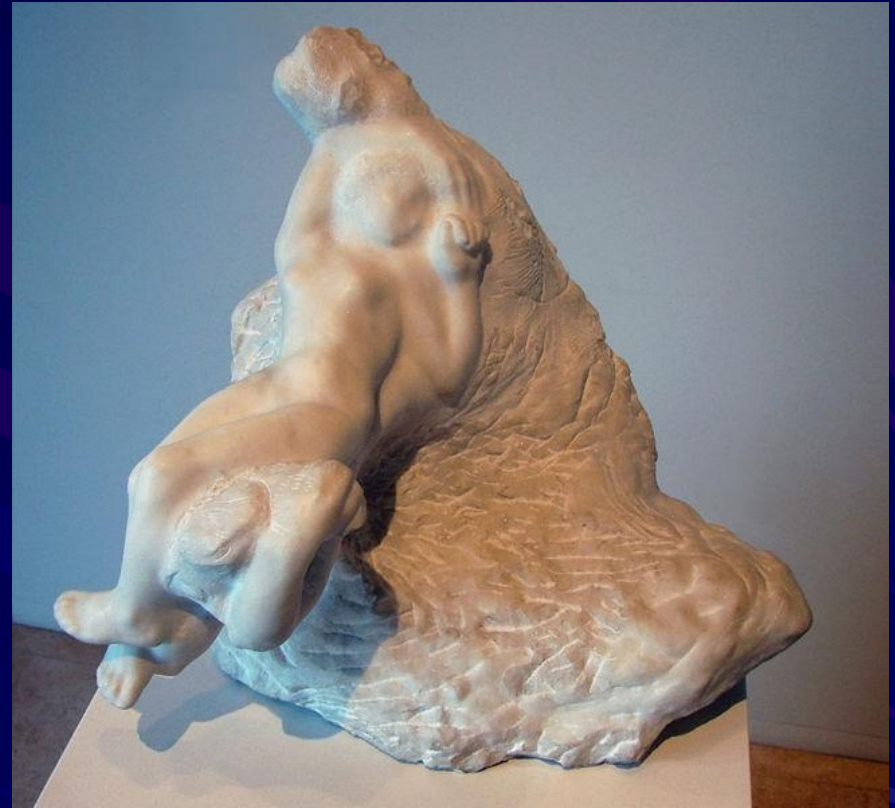
Огюст Роден (Амур и Психея)