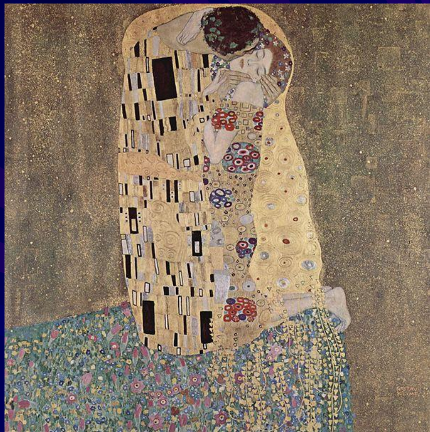
Густав Климт «Поцілунок» 1907—1908 рр.