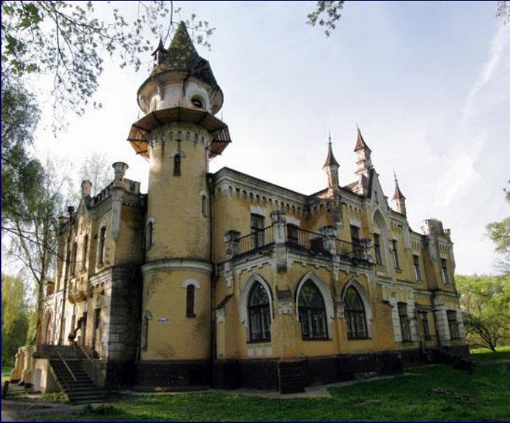
Будинок Григорія Глібова, Чернігів