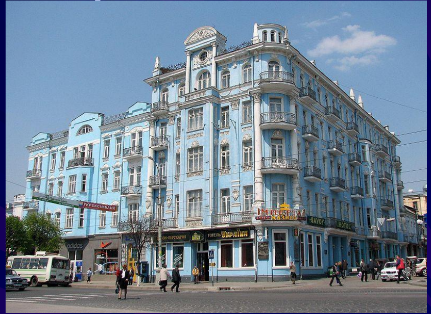
Готель «Савой» Готель «Савой», Вінниця