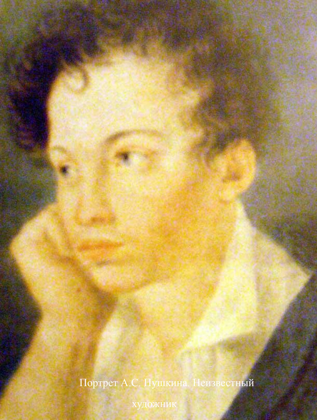
Портрет А.С. Пушкина. Неизвестный