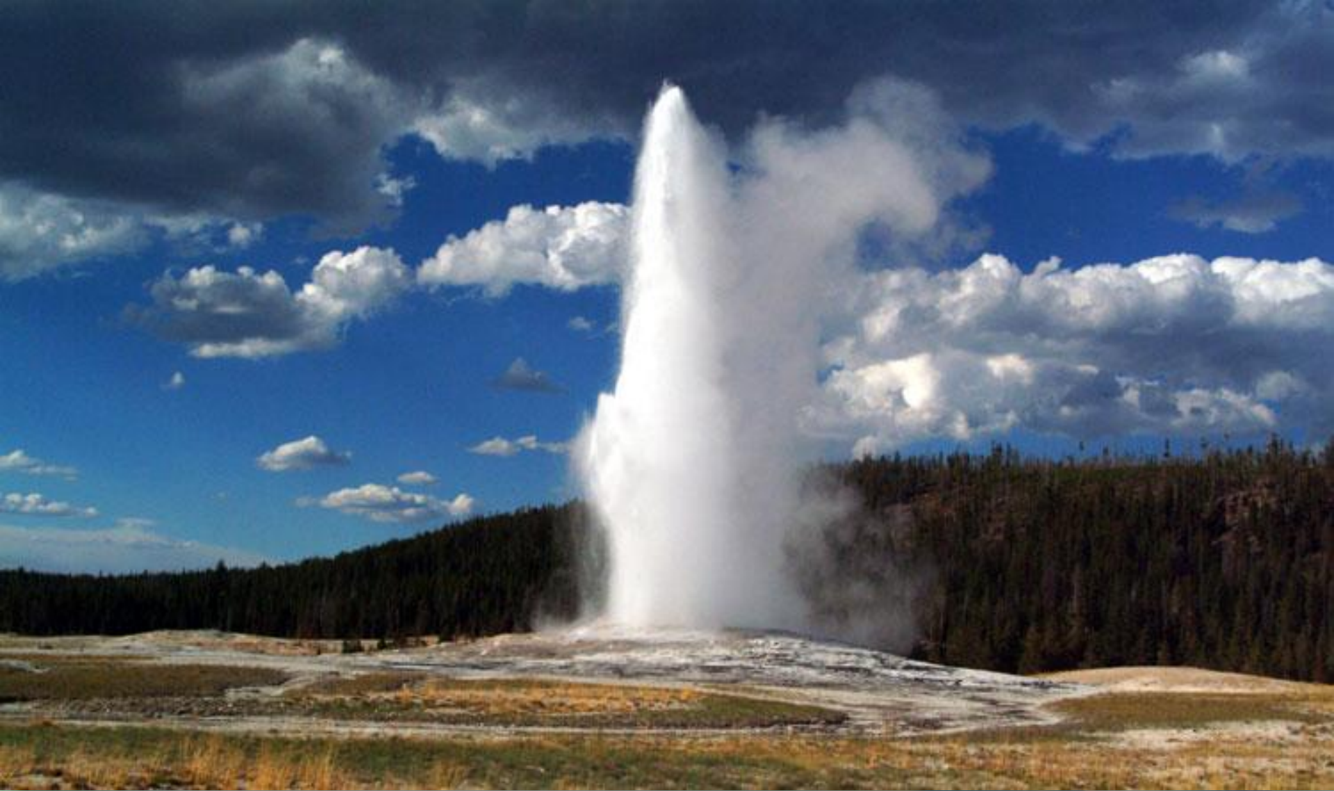
Гейзер "Старий служака"