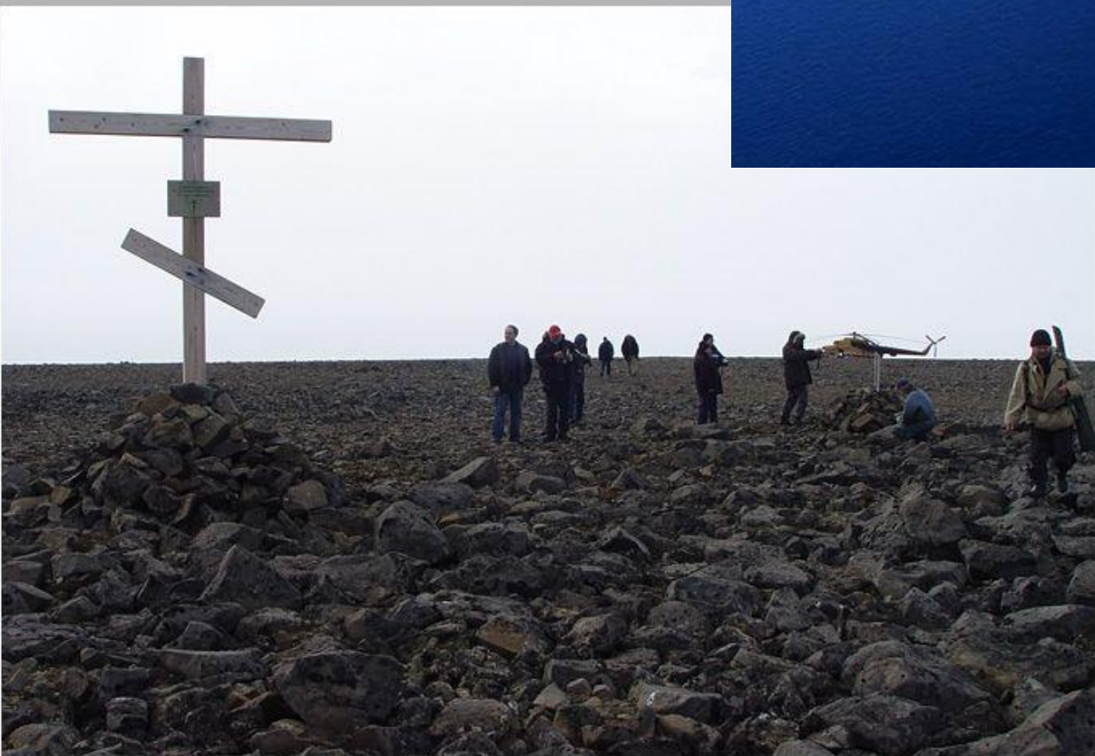
Арктика-2007. 26 рейс НЭО Академик Федоров. Земля Франца Иосифа. Остров Рудольфа. Мыс Фингелн. Крест в честь Георгия Седова.