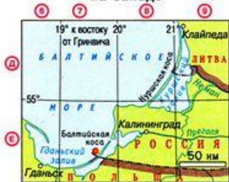
на Балтийской косе - 19^{\circ}38' в.д.