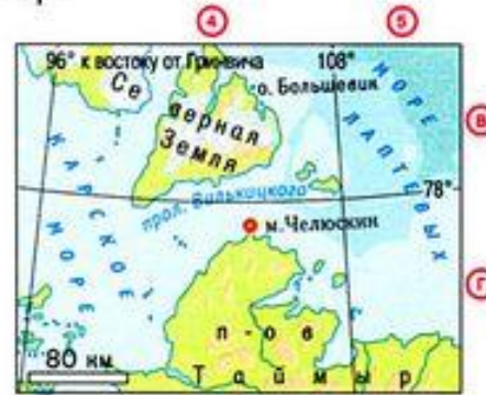
мыс Челюскин - 77^{\circ}43' с.ш.