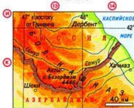
к юго-западу от горы Базардюзю - 41^{\circ}10' с.ш.