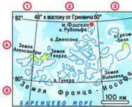
мыс Флигели на острове Рудольфа - 81^{\circ}51' с.ш.