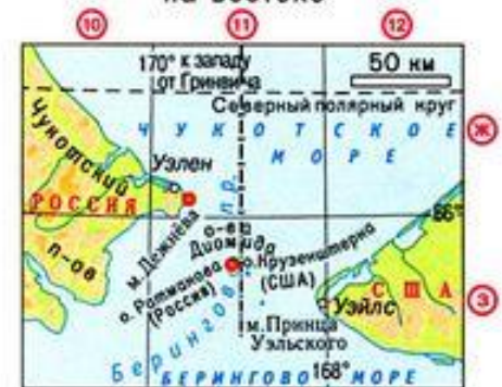
мыс Дежнёва - 169^{\circ}40' в.д. восточное побережье острова Ратманова - 169^{\circ}02' в.д.