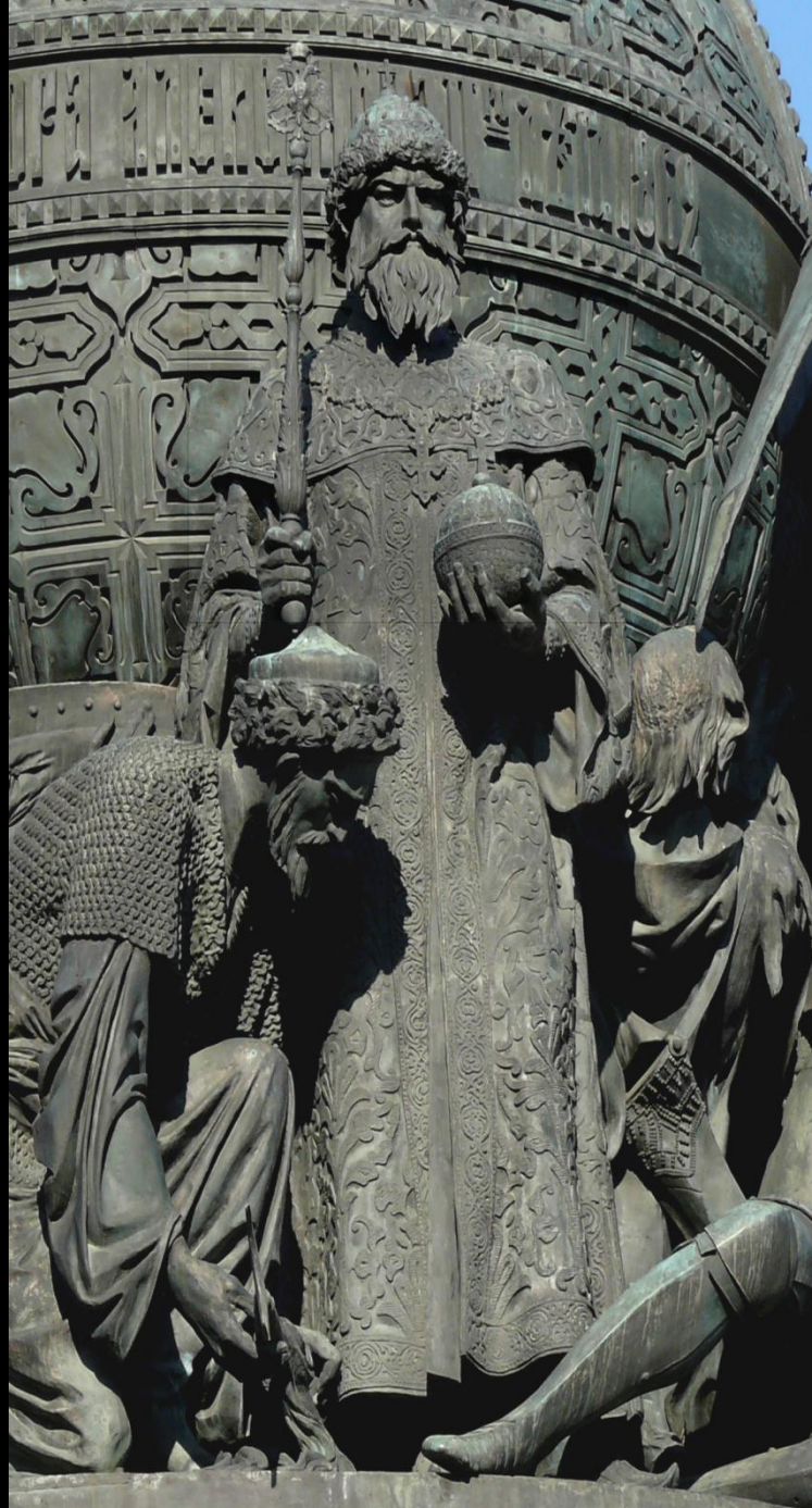
Иван I I I