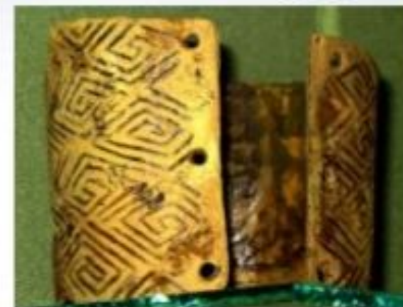
1. Статуетка з бивня мамонта. Мізинська стоянка