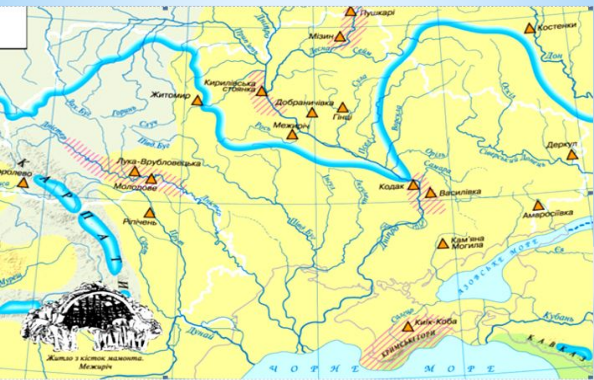
Стоянки на території України