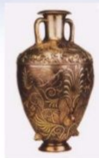
7. Срібна амфора з кургану Чортомлик . Перша половина IV ст. до н.е.