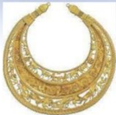
5. Золота пектораль із кургану Товста могила . IV ст. до н.е.