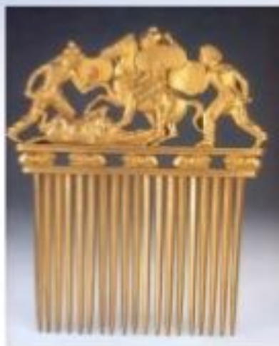
6. Золотий гребінь із кургану Солоха . Кінець V – початок IV ст. до н.е.