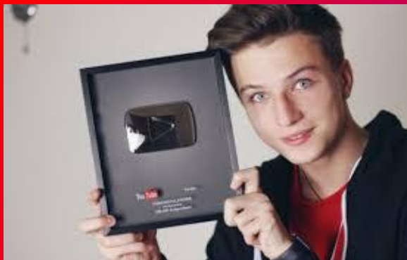
3. Іван Гай