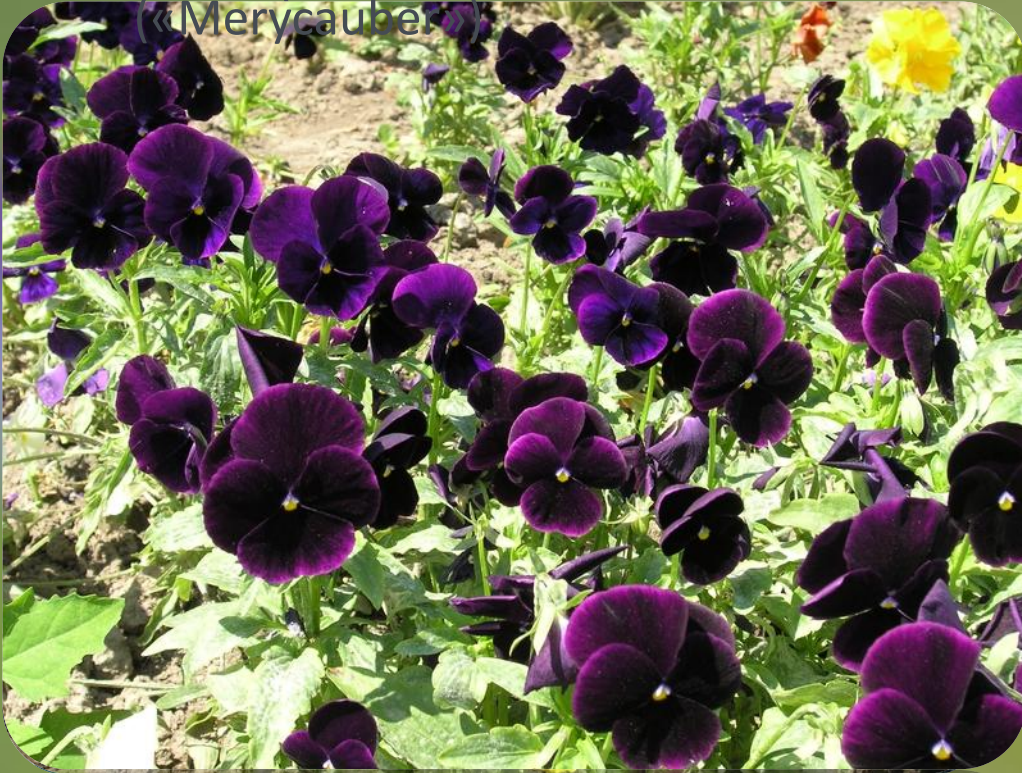
«Меренбер» (Meru-ber) («Merusauber»)

Висота рослини 15-20 см. Квітки зті, з діаметром 4-6 см, тичинки фіолетові. Пелюстки вогненно-червоні з темними плямами, діаметром більше 6 см.