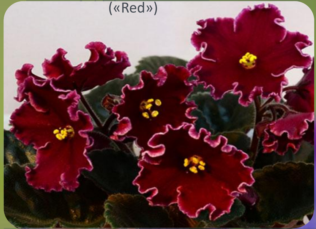
«Кордівеск» (Cordiv-esc) («Red»)

Висота рослини 15-20 см. Квітки темно-червоного кольору з темними плямами на трьох нижніх пелюстках, діаметром 4-6 см. Тичинки жовті, з темними плямами на трьох нижніх пелюстках.