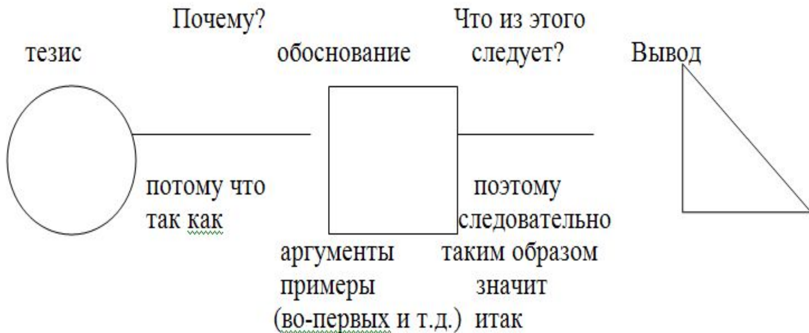
Схема полного рассуждения