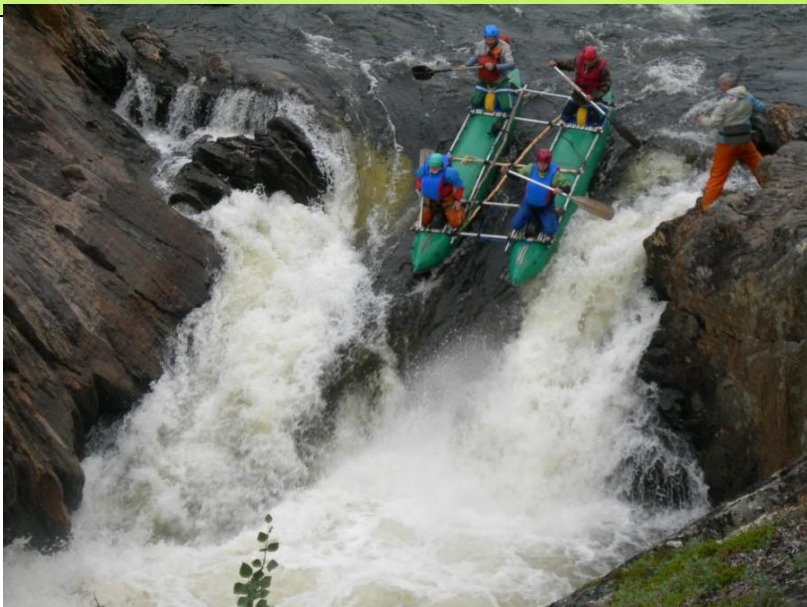
Прохождение порога Прорыв (5-6 к.с.) http://www.turizmvnn.ru/cont/show/18516/