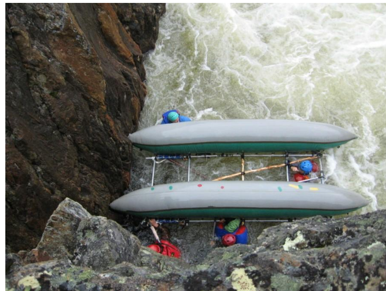
Прохождение порога Пятый Падун (5к.с.) Река Западная Лица http://www.turizmvnn.ru/cont/show/18896/