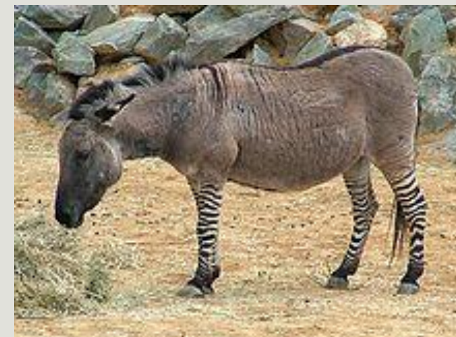
Гибрид зебры и домашнего осла