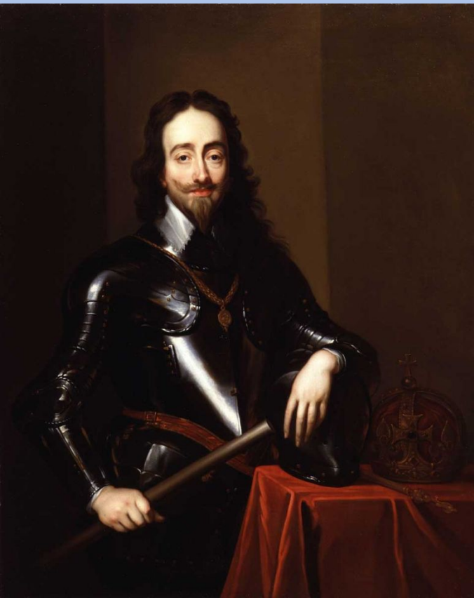
Карл Стюарт – король Англии до 1649