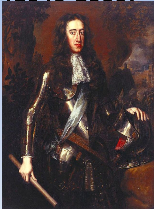
Вильгельм III Оранский – вождь Славной революции