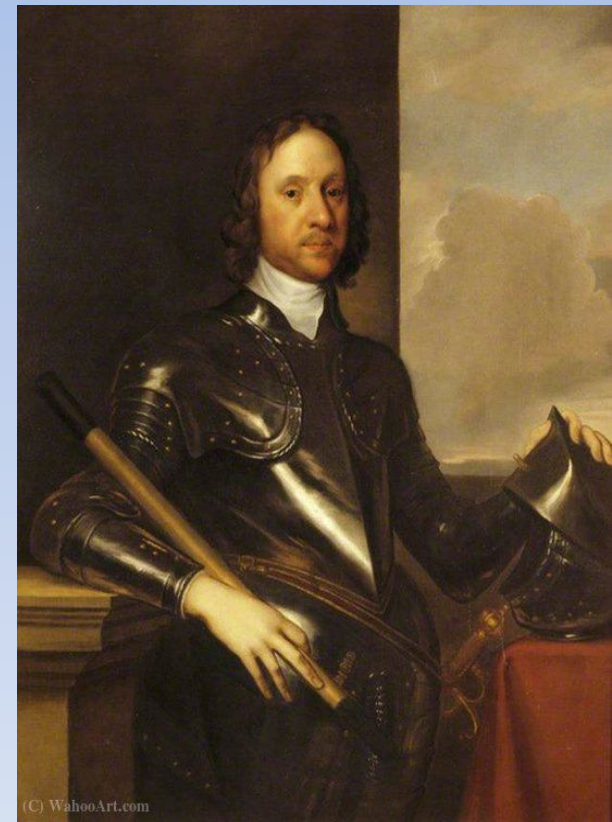
Оливер Кромвель. Протекторат Кромвеля (1653-1659)