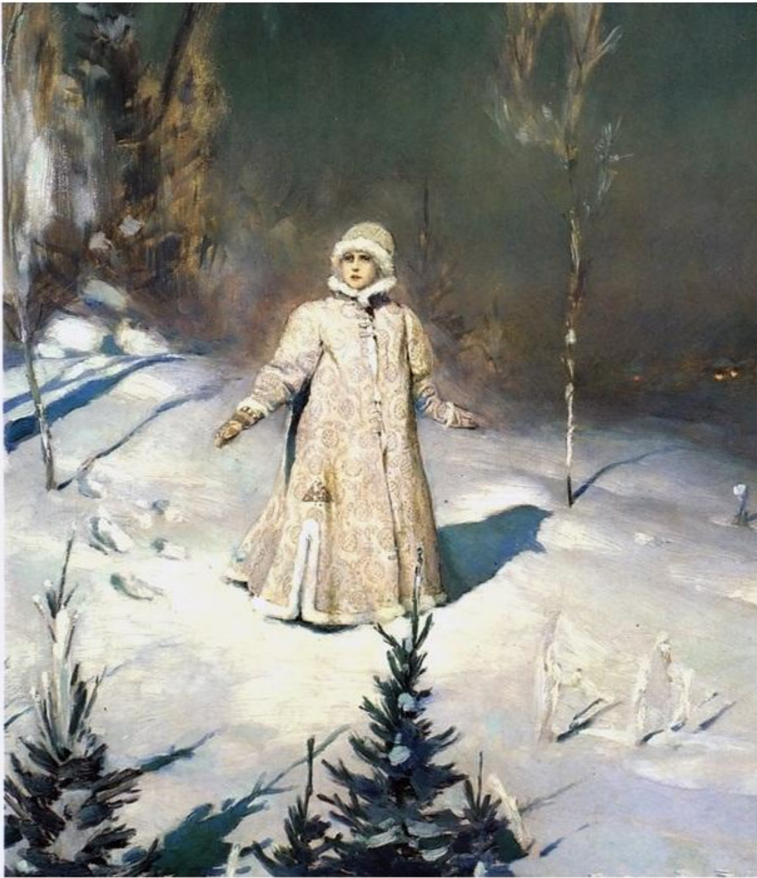
В.М. Васнецов «Снегурочка»