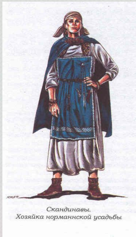
Скандинавы. Хозяйка норманнской усадьбы.