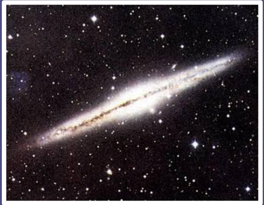
Галактика Млечный путь (вид сбоку)