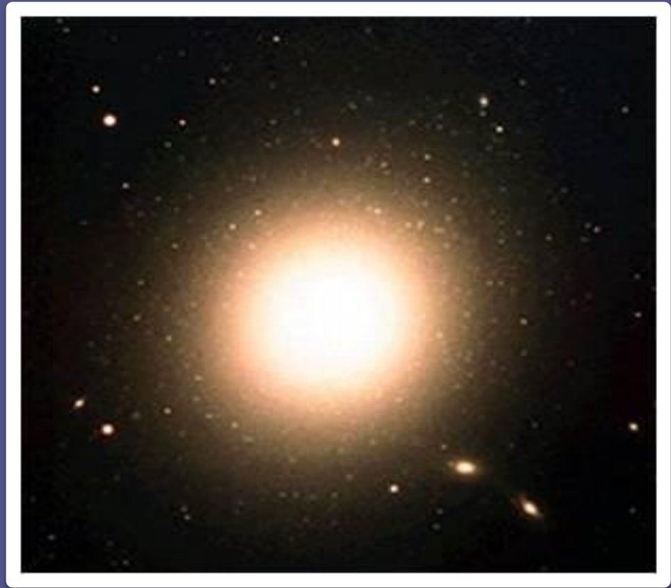
Эллиптическая галактика M87