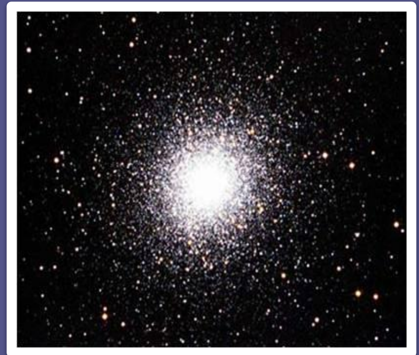
скопление M13 в созвездии Геркулеса