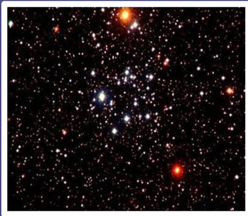
скопление M50 в созвездии Единорога