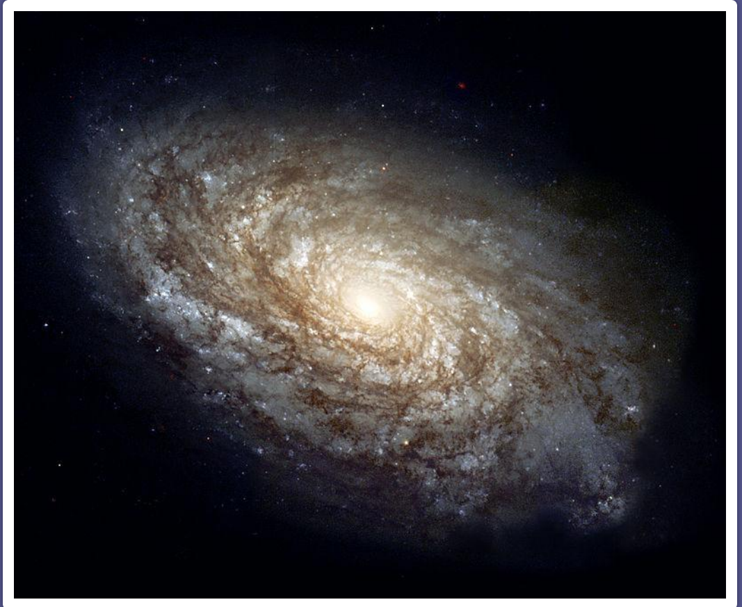
спиральная галактика NGC 4414 из созвездия Волосы Вероники