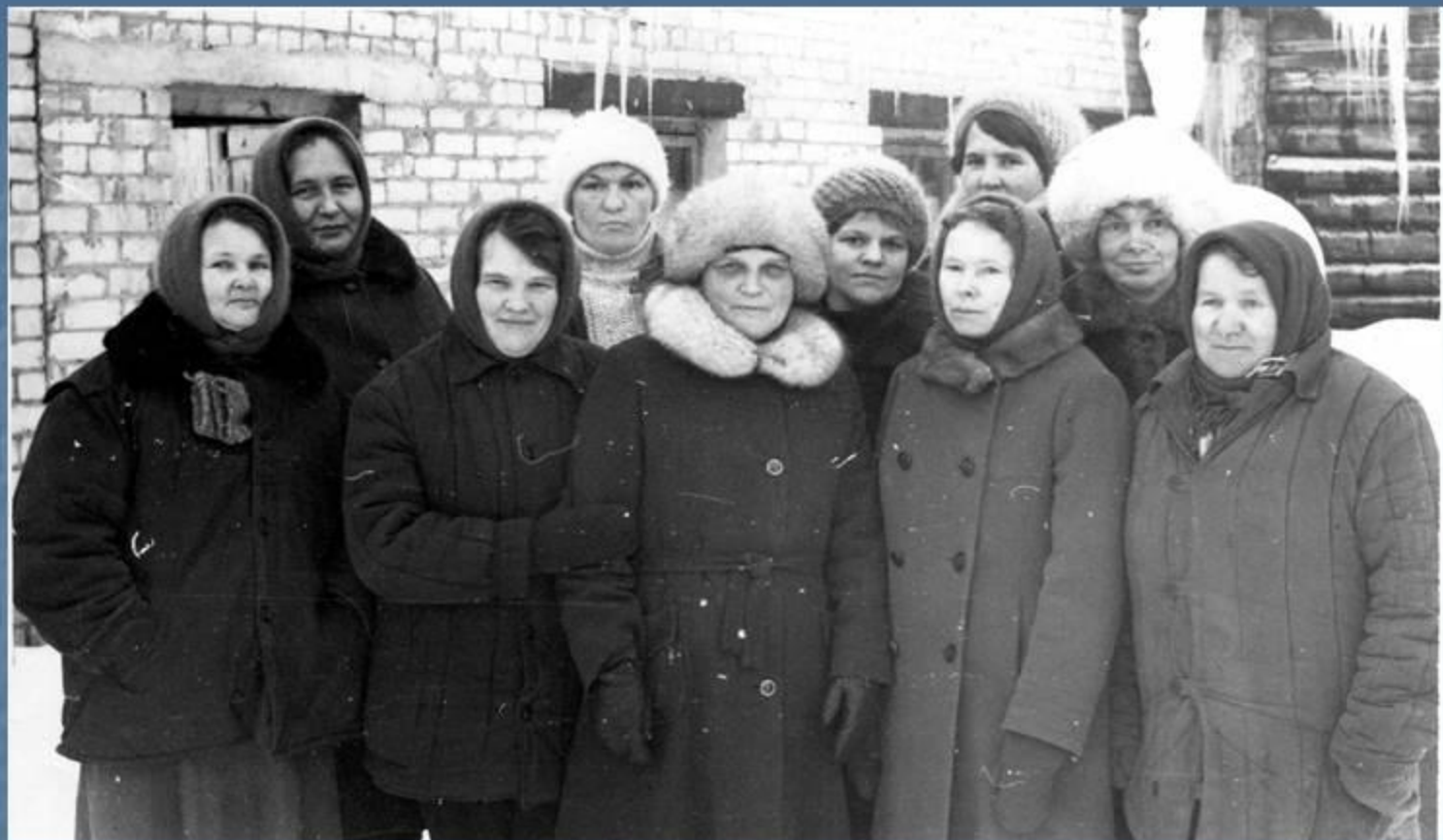
ЖИВОТНОВОДЫ. 2 ферма