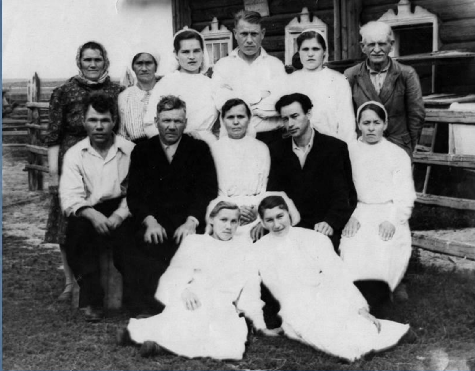
■ Коллектив маслозавода