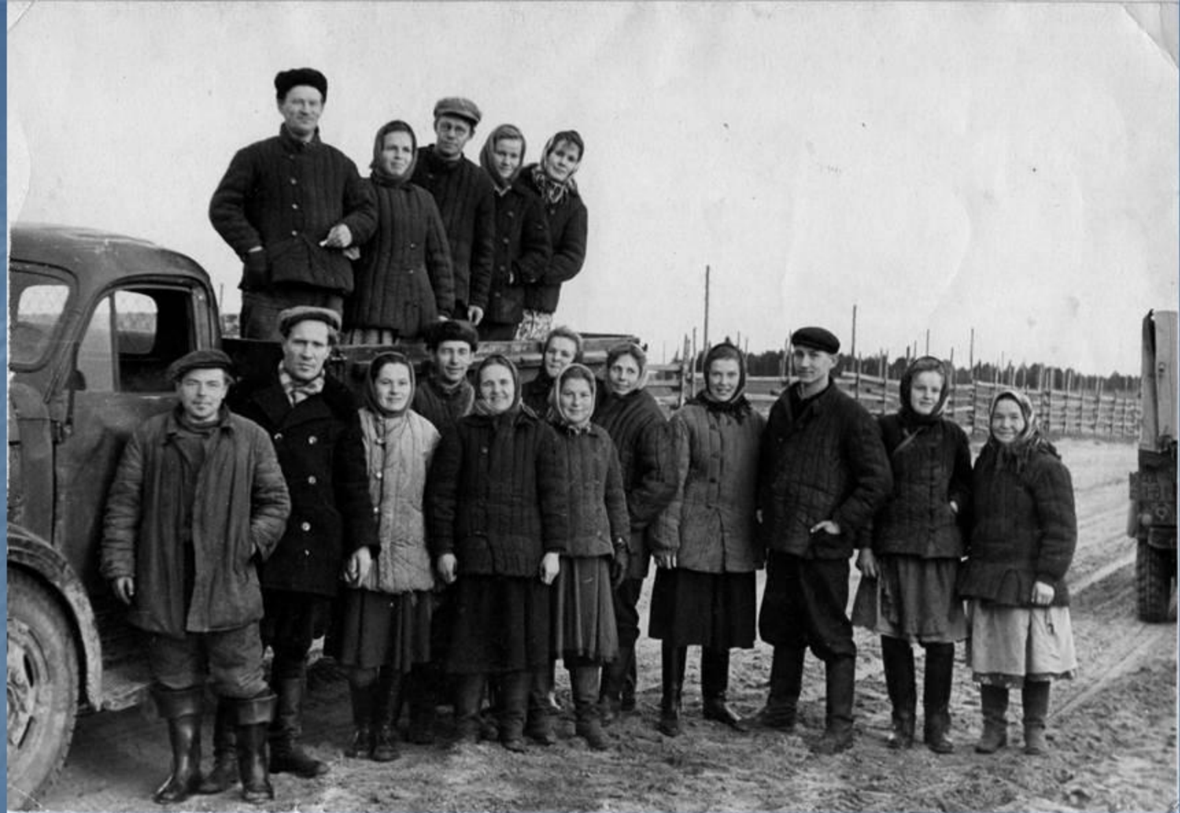
■ Субботник по заготовке мха.