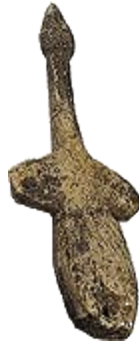
Птичка. Поздний палеолит 22-21 тыс. лет до н.э.