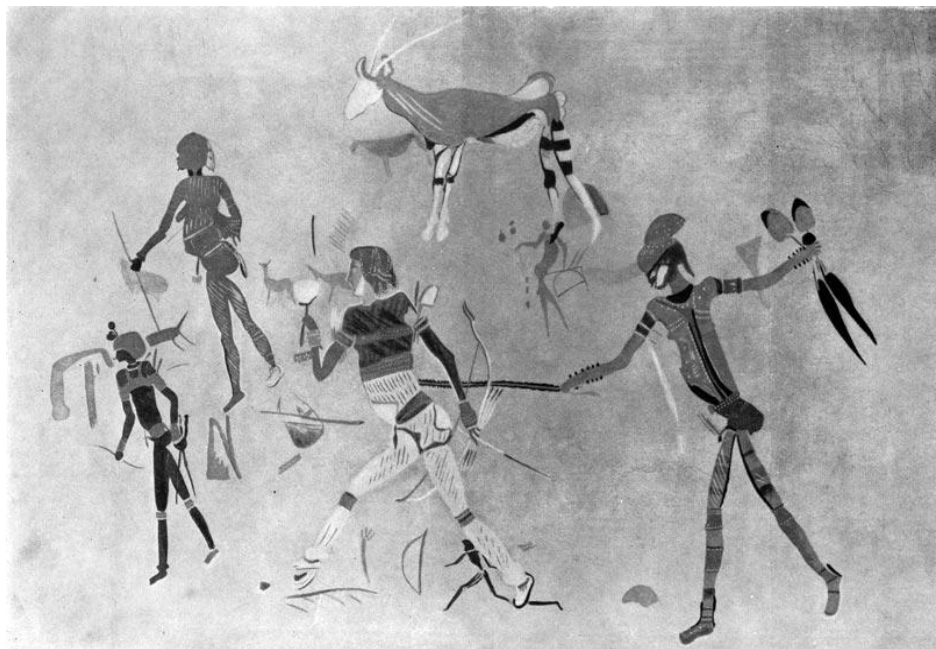
Наскальная живопись бушменов