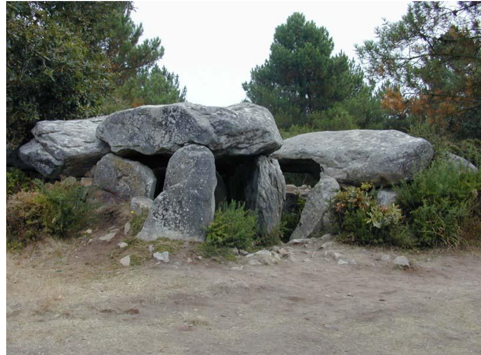
Мегалитическое захоронение в Бретании (мегалит)