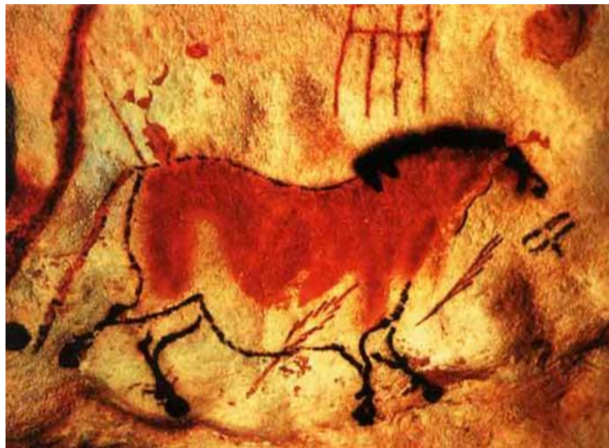
Наскальные рисунки в пещере Ласко. Франция