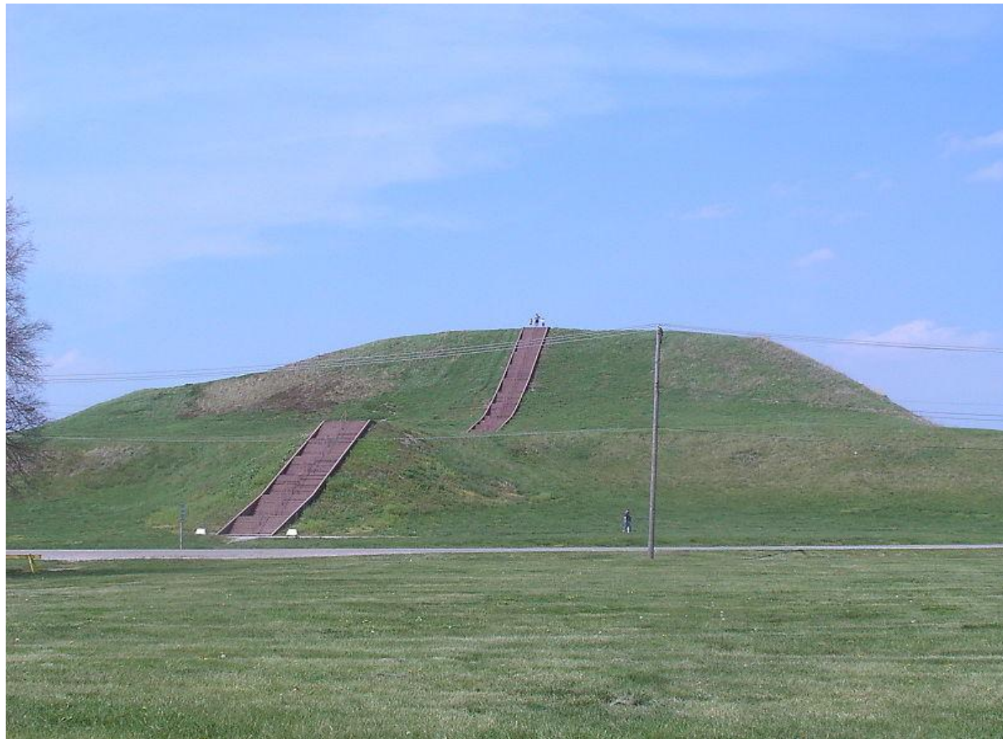
Курган монахов в Кахокии. США

КУРГАН - разновидность погребальных памятников, распространённая на всех континентах, кроме Австралии и Антарктиды. Характеризуется, как правило, сооружением земляной насыпи над погребальной ямой.