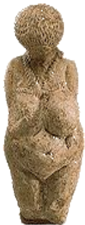
Женская статуэтка 23-21 тыс. лет до н.э.