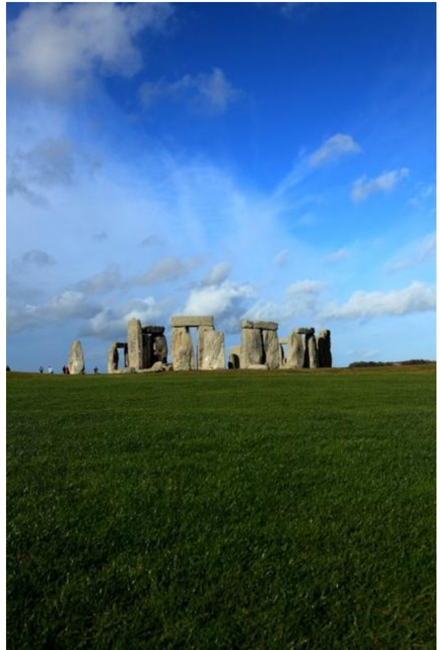
Кромлех Стоунхендж. Англия

КРОМЛЕХ – это древнее (времен неолита, бронзового века и позднее, вплоть до раннего Средневековья) сооружение, представляющее собой несколько поставленных вертикально в землю обработанных или необработанных продолговатых камней (менгиров), образующих одну или несколько концентрических окружностей., самый грандиозный возведен в Стоунхендже (нач. 2 тыс. лет до н.э., Южная Англия)ю