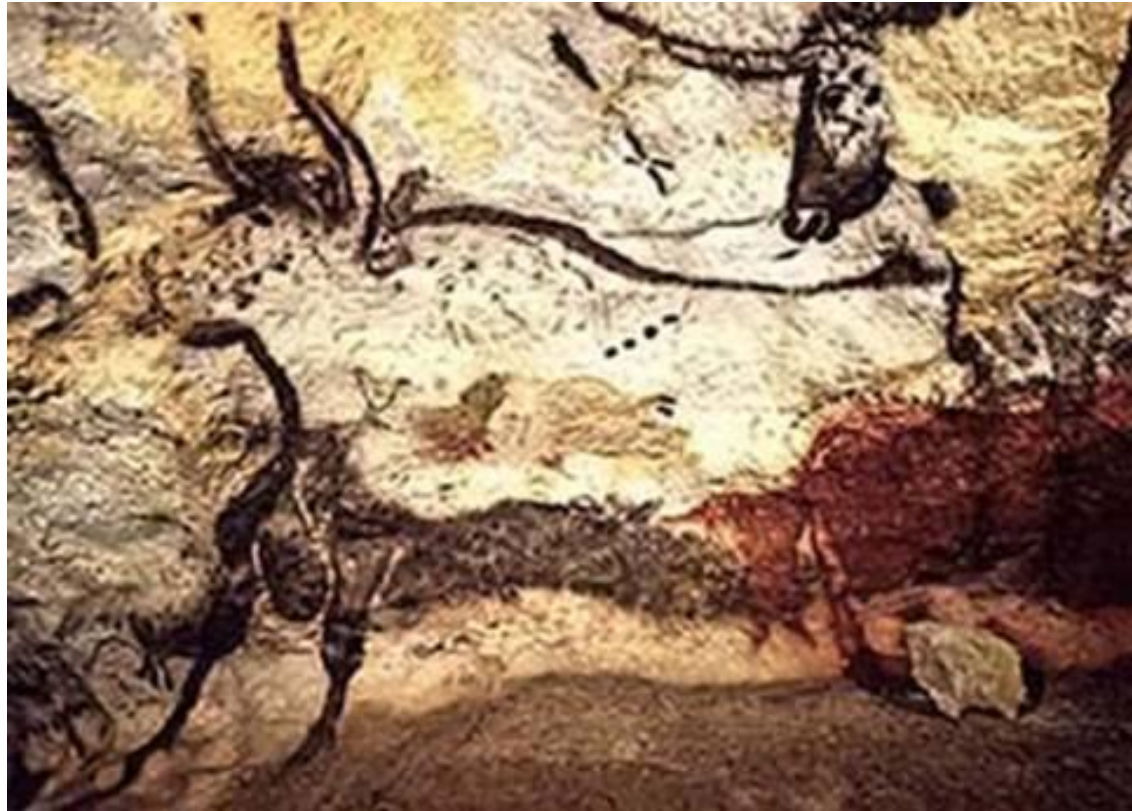
Наскальные рисунки в пещере Ласко. Франция