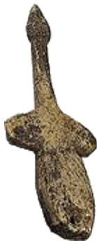
Птичка. Поздний палеолит 22-21 тыс. лет до н.э.