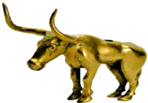
Бычок. Неолит середина III тыс. до н. э.

Это изображения животных, женщин (прародительниц человеческого рода).