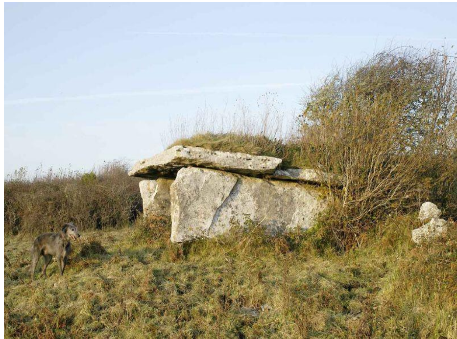
Дольмен в Ирландии

ДОЛЬМЕН – это погребальные сооружения из двух или 4-х отвесно поставленных обтесанных камней, перекрытых горизонтальной плитой. Внутреннее пространство ДОЛЬМЕНА служило для родовых захоронений (в Зап.Европе, Сев.Африка, мегалитические сооружения в Крыму , на Кавказе 5-2 тыс. лет до н.э.).