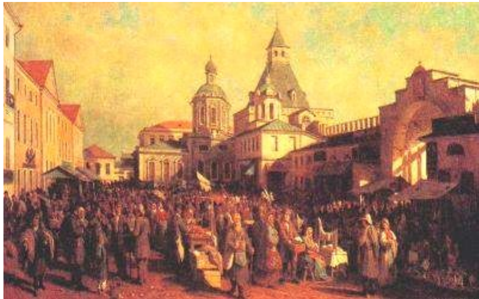
В.Верещагин Нижегородская ярмарка.