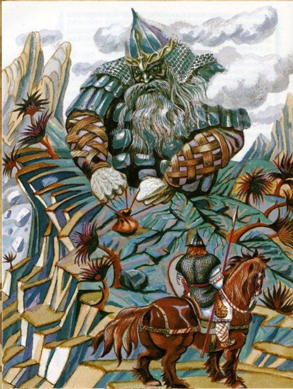
Георгий Юдин Микула Селянинович и Святогор.