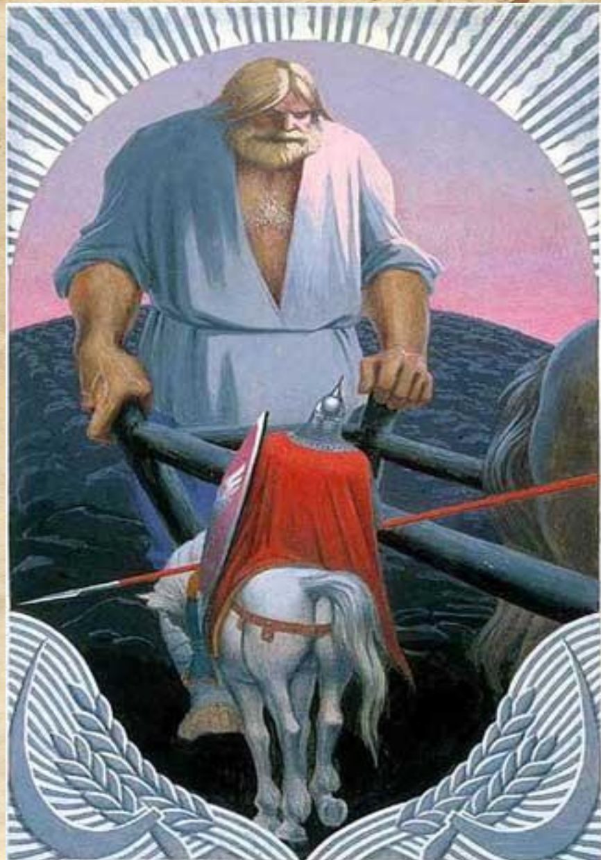
Константин Васильев «Встреча Вольги и Микулы Селяниновича»