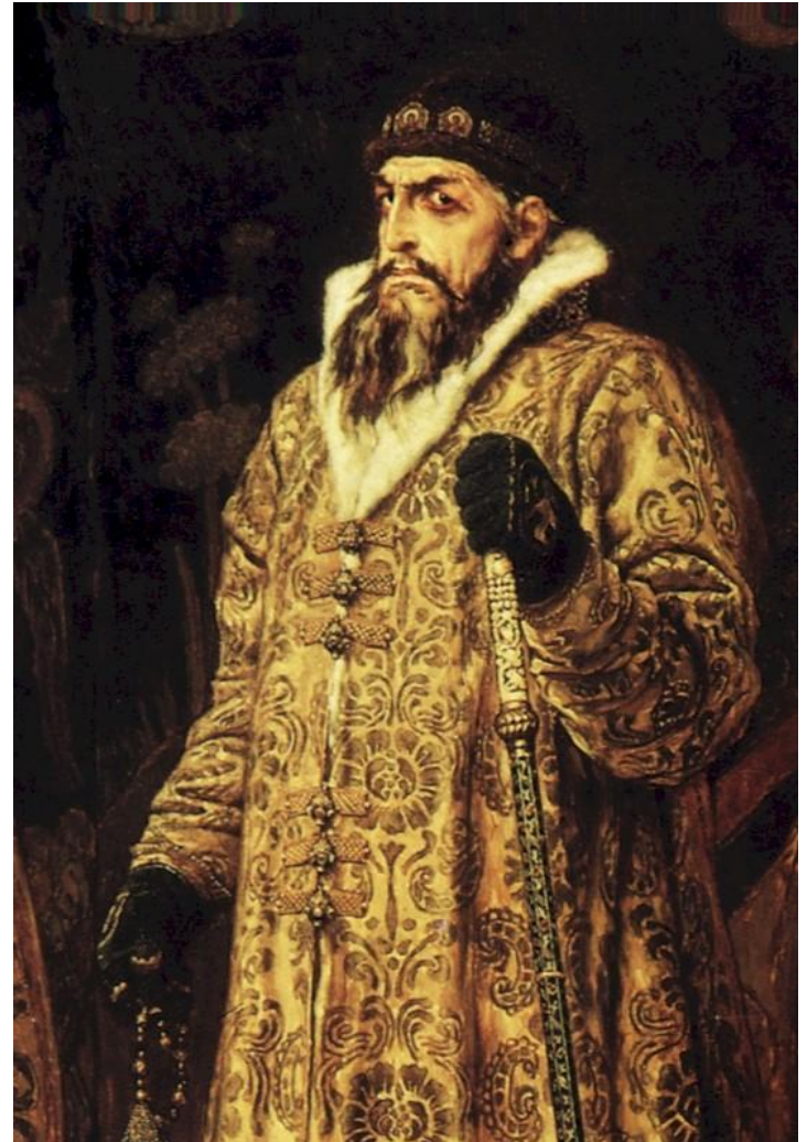
В.М.Васнецов. Иван Грозный

Из фильма выписать, какие личные качества были свойственны царю? Почему его правление оценивается по-разному историками?