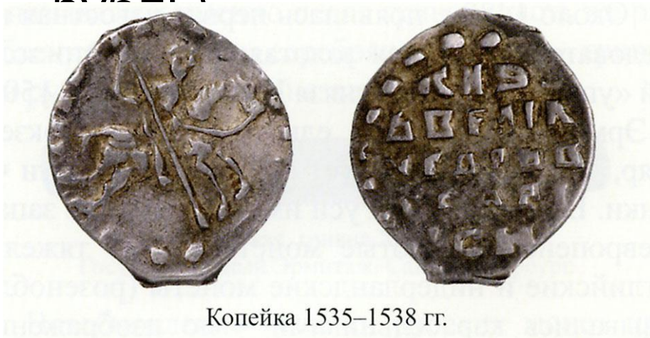
Копейка 1535–1538 гг.