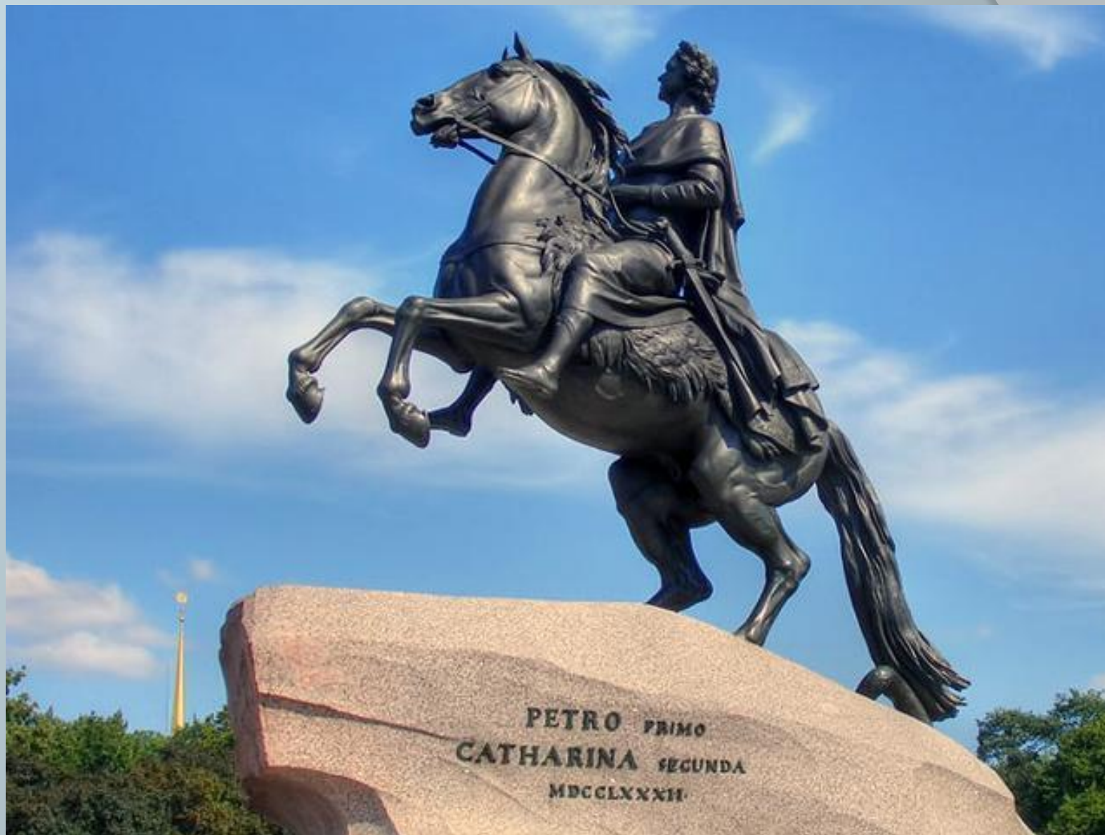
Памятник Петру I. 1768—1770гг.