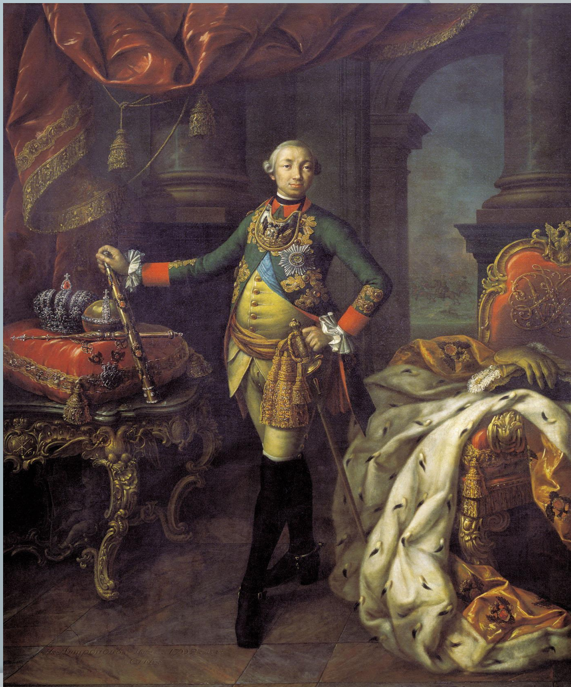
Парадный портрет Петра III А. П. Антропов. 1762 год