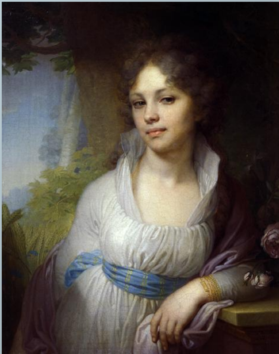
Портрет Марии Лопухиной В. Л. Боровиковский. 1797 г