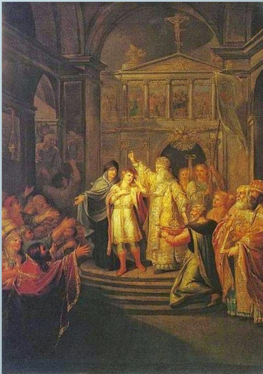
Избрание Михаила Федоровича на царство. Г.И. Угрюмов. Около 1800