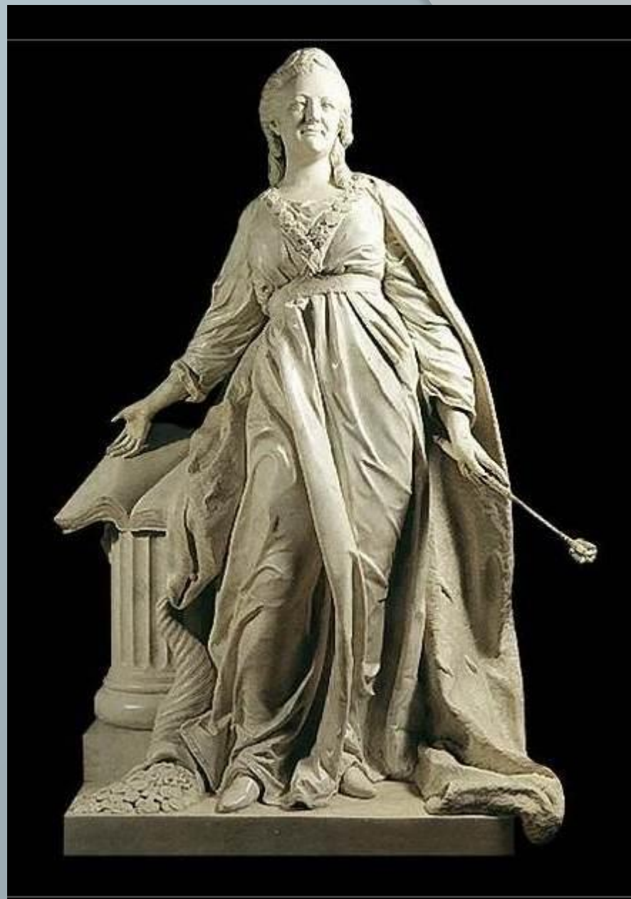
Статуя Екатерина II- Законодательница. 1789