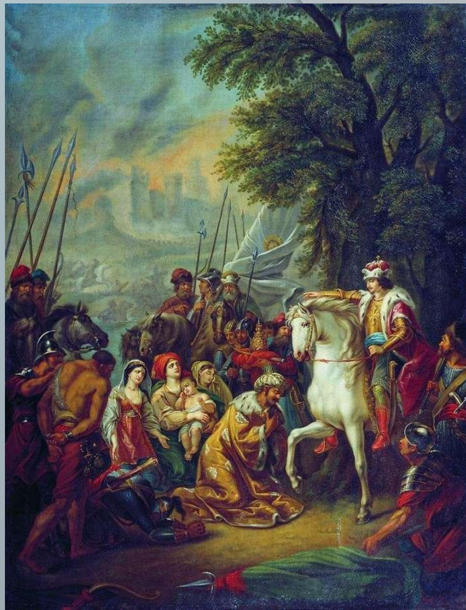
Взятие Казани Д.И. Угрюмов. Около 1880