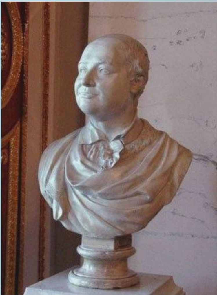
Скульптурный портрет М.В. Ломоносова, 1792