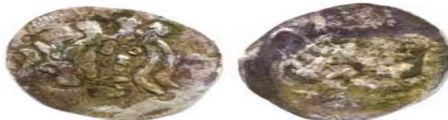
Монета Ягайло Ольгердовича, Вильно, 1387-1388 гг. Серебро, диаметр 14 мм, вес 0.60 гр.