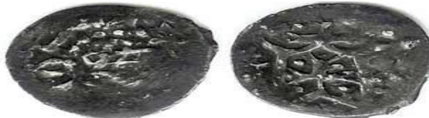
Монета Владимира Ольгердовича, Киев, 1363-1377 гг. Серебро, диаметр 14 мм, вес 0.50 гр.