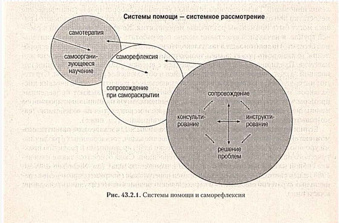
Рис. 43.2.1. Системы помощи и саморефлексия

Вся профессиональная сфера жизни сотрудников может зависеть во время кризисов от быстрого профессионального анализа, советов и решений. Только после этого открываются возможности для дальнейшей терапевтической помощи. Профессиональная психологическая консультация, инструктаж и сопровождение консультантом, анализ и решение профессиональных проблем самим обратившимся за помощью образуют тесно взаимосвязанное единство. Лишь в ходе процесса может возникнуть помощь, близкая к психотерапевтической. Большую роль играют процессы самораскрытия, саморефлексии, самонаблюдения, самооценки